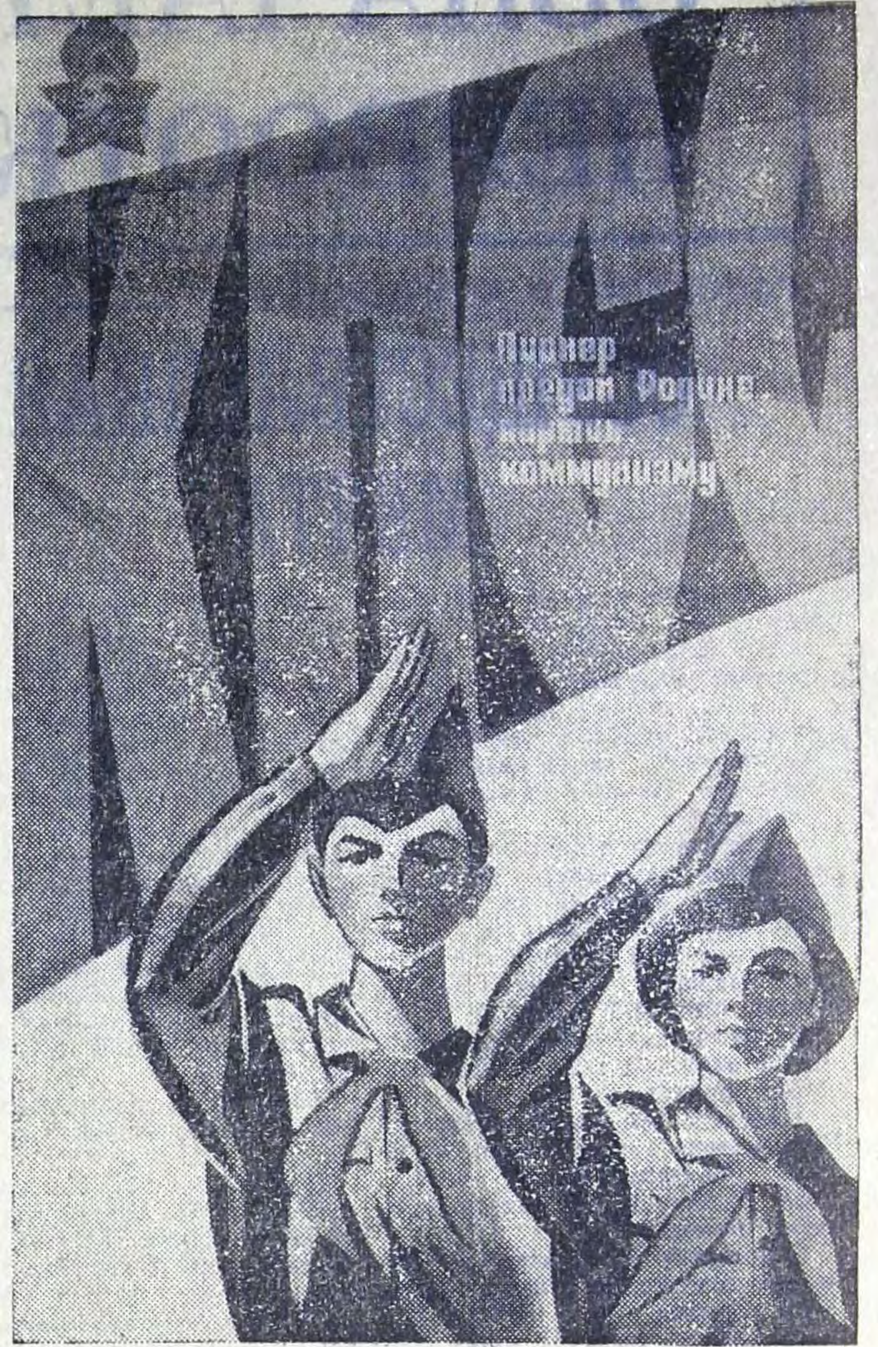
Плакат художника В. Сачкова (издательство «Изобразительное искусство»).