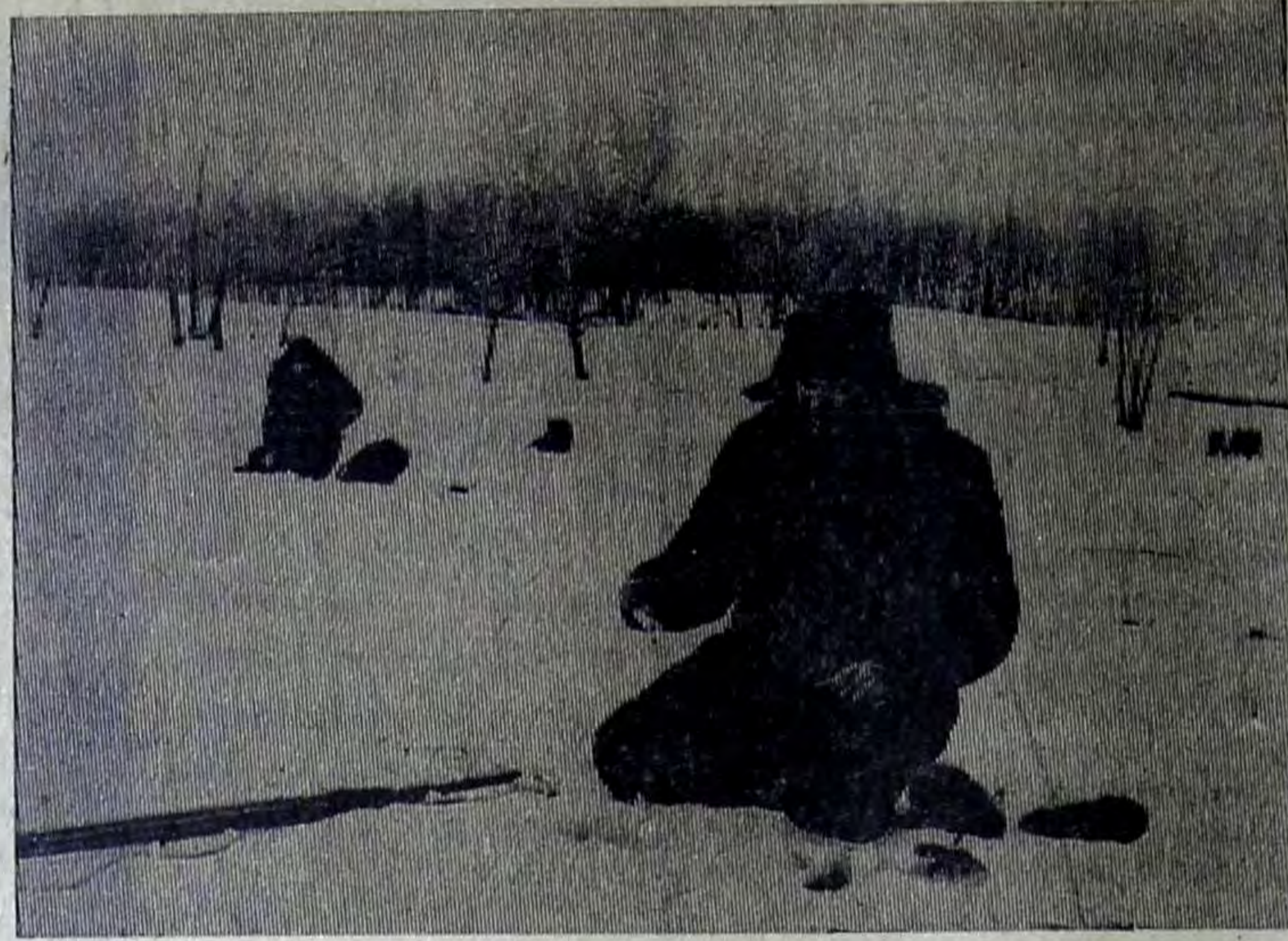
«Ловись, рыбка, и мала, и велика».