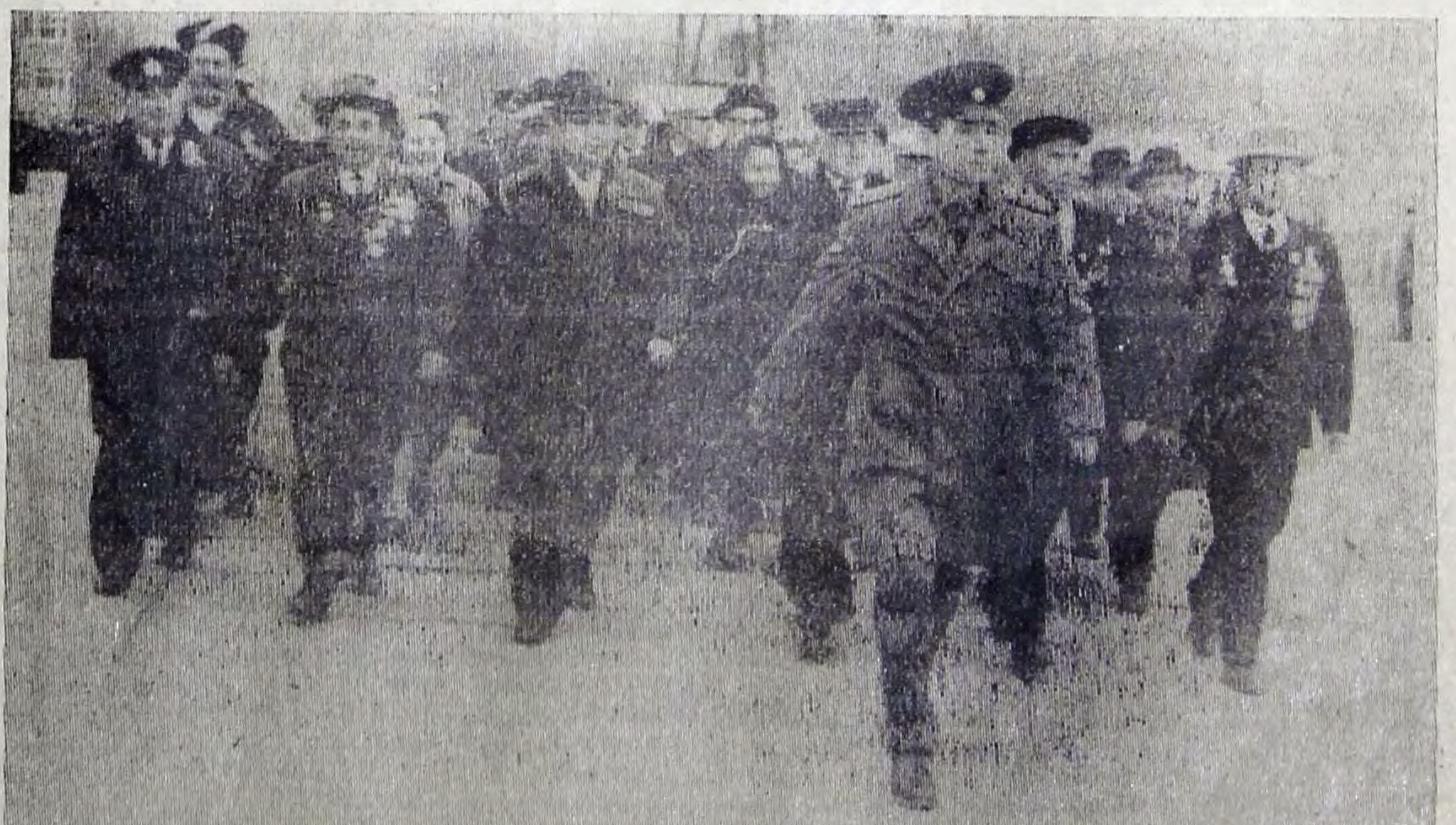
1 Мая. Праздничную демонстрацию трудящихся Балакова открыла колонна ветеранов партии, войны и труда.