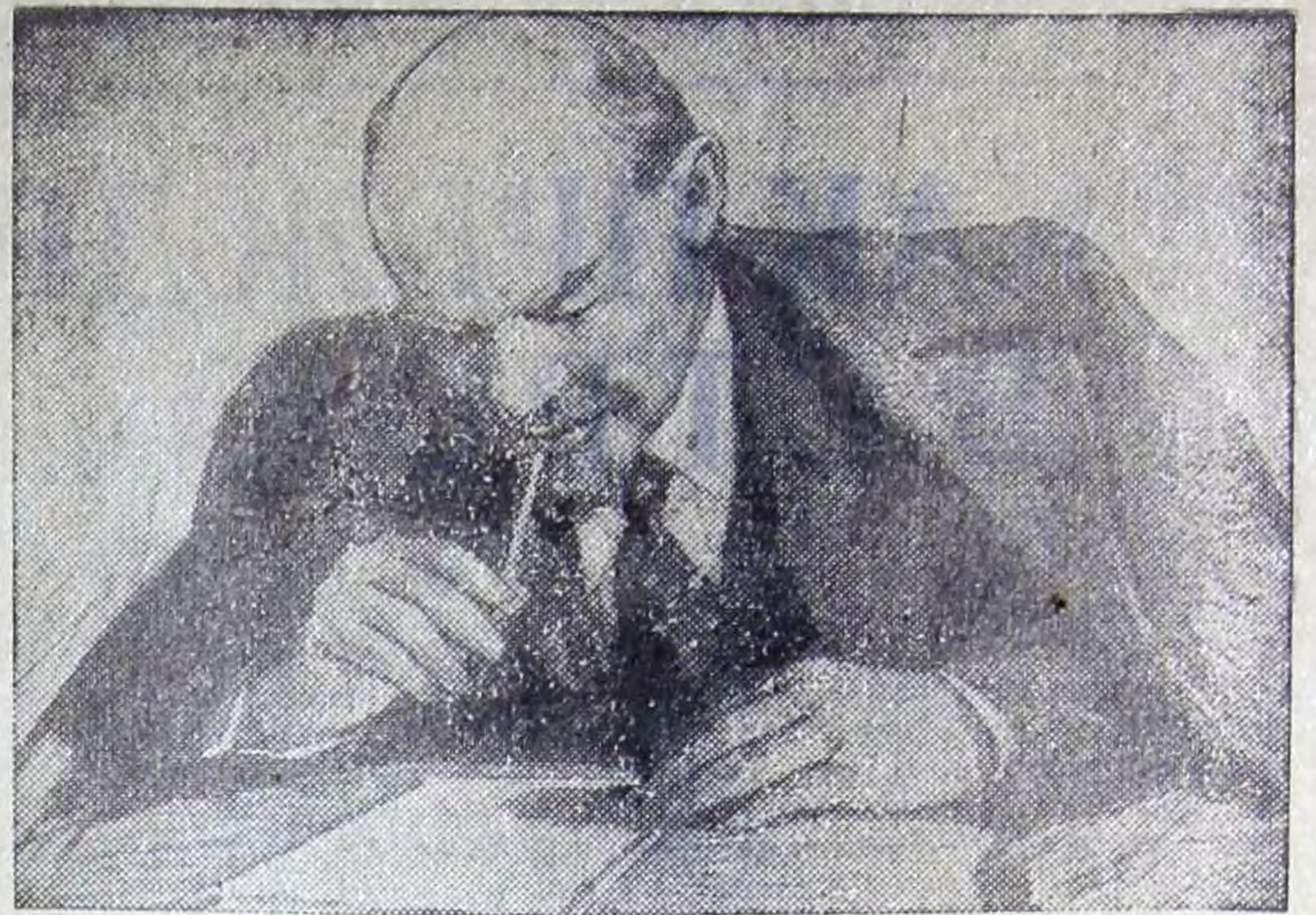
«В. И. Ленин за работой» — карандашный рисунок народного художника РСФСР П. В. Васильева. Фотохроника ТАСС

№ 72 (7329) ♦ Пятница, 5 мая 1972 года ♦ Год издания 55-й ♦ Цена 2 коп.