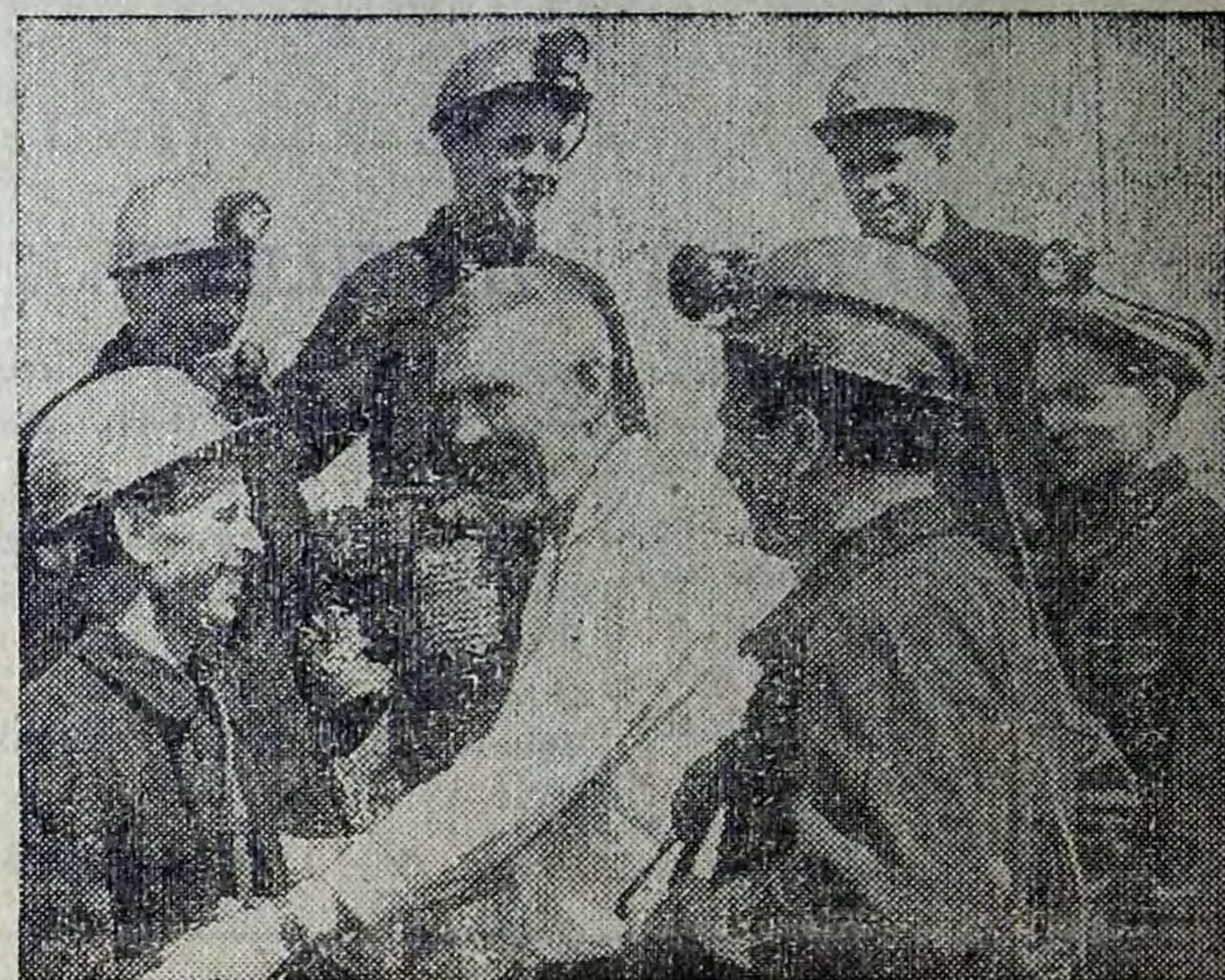
«Трудовое напутствие Алексея Стаханова».