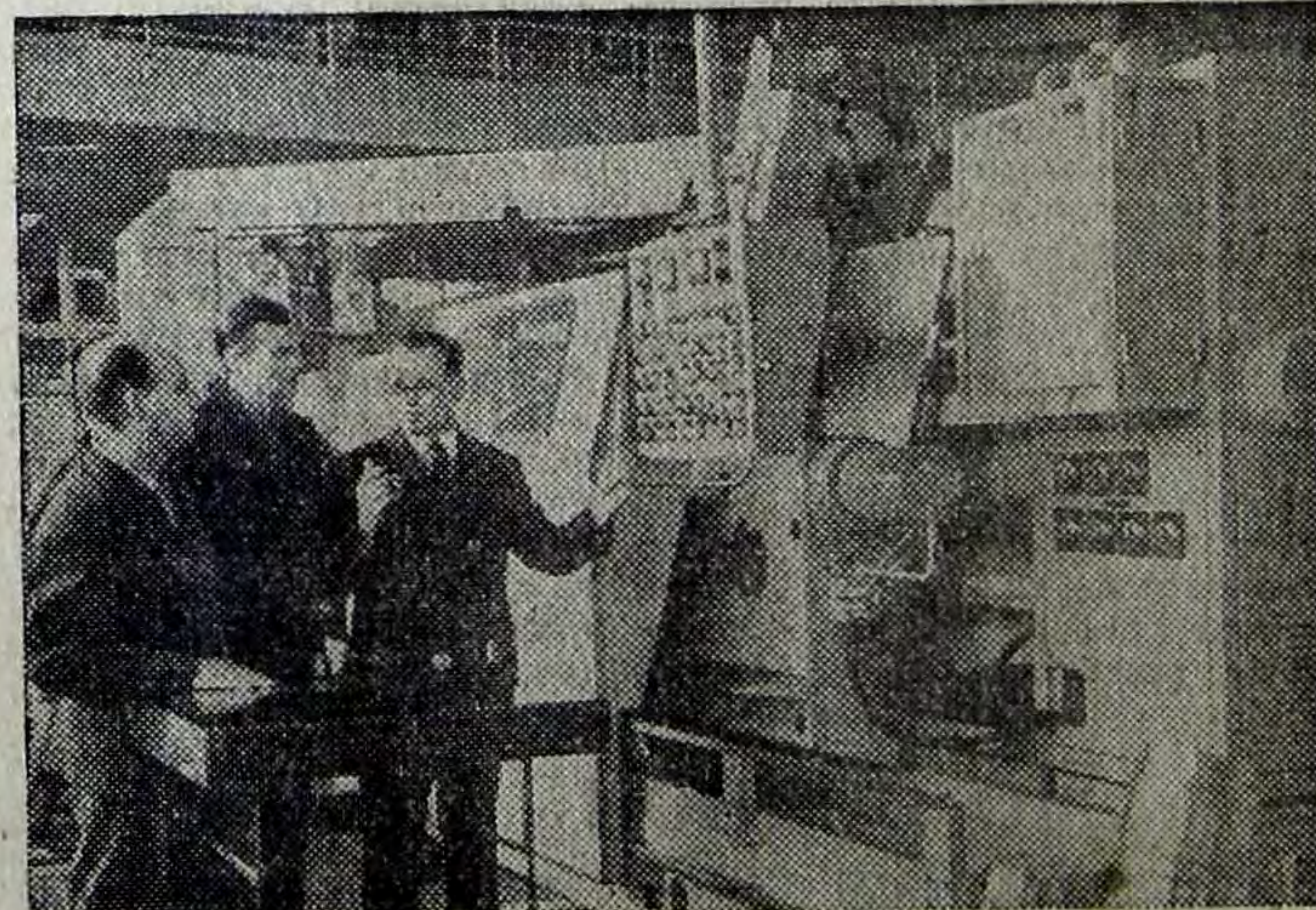
станок, предназначенный для обработки в центрах изделий типа ступенчатых валов, гильз двигателей внутреннего сгорания большой мощности, муфт

На снимке: один из экспонатов выставки — токарный гидрокопировальный полуавтомат с системой автоматического управления — модель «ИВ732САУ» московского станкостроительного завода имени С. Орджоникидзе. Этот