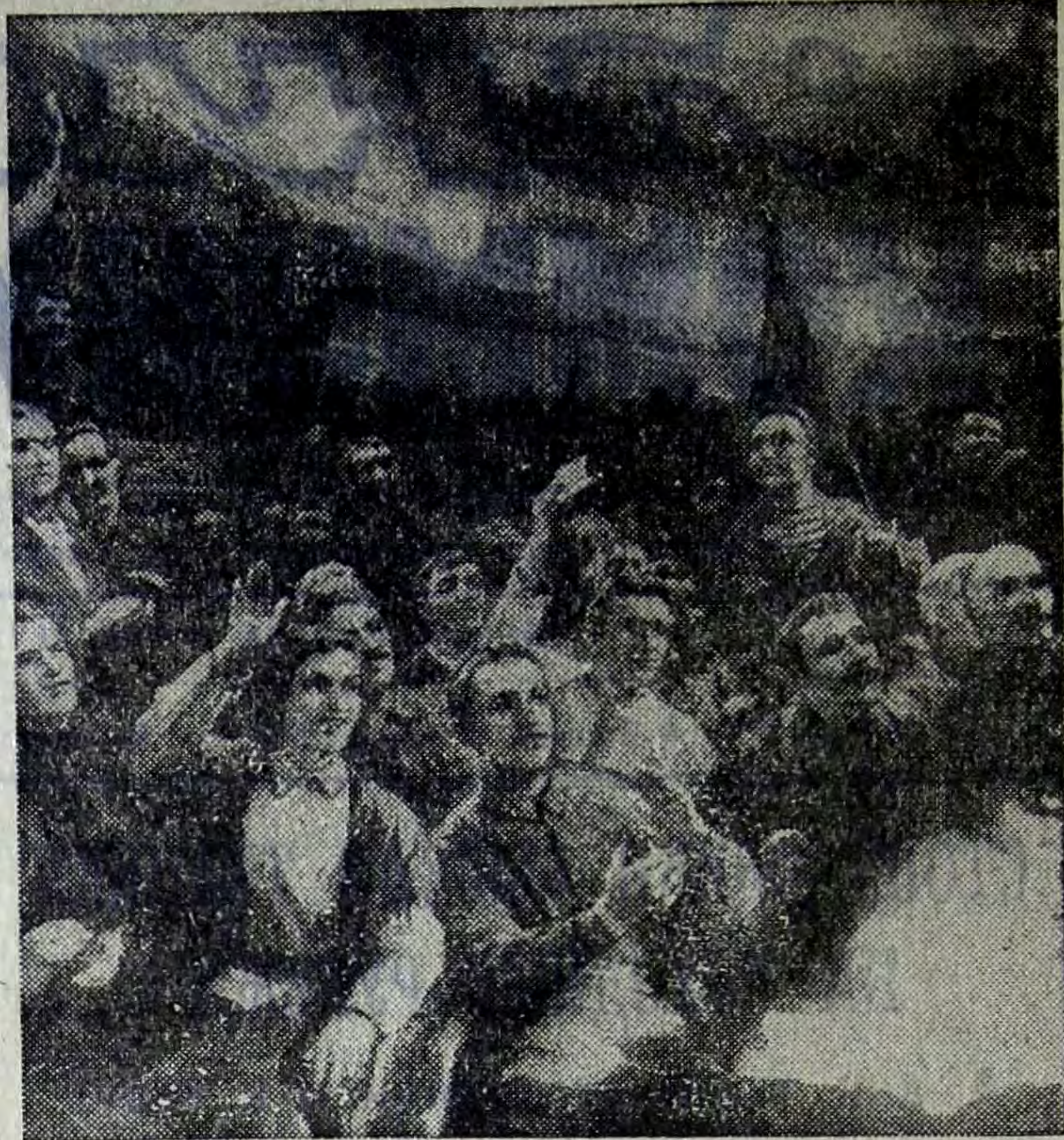
На десятом Всероссийском съезде Советов (1922 год) была принята резолюция об образовании СССР.