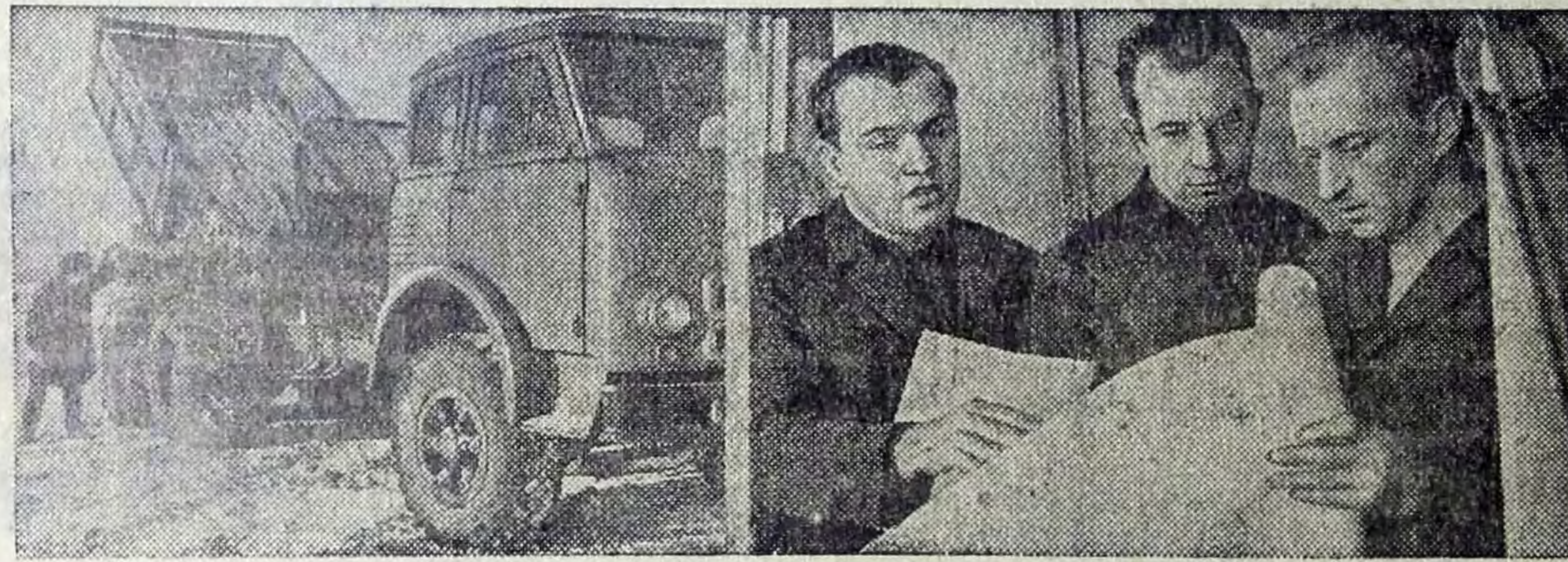
Белорусская ССР. Коллектив Бобруйского завода сельскохозяйственных машин (Могилевская область) изготовил первый образец разбрасывателя органических удобрений грузоподъемностью 12 тонн.