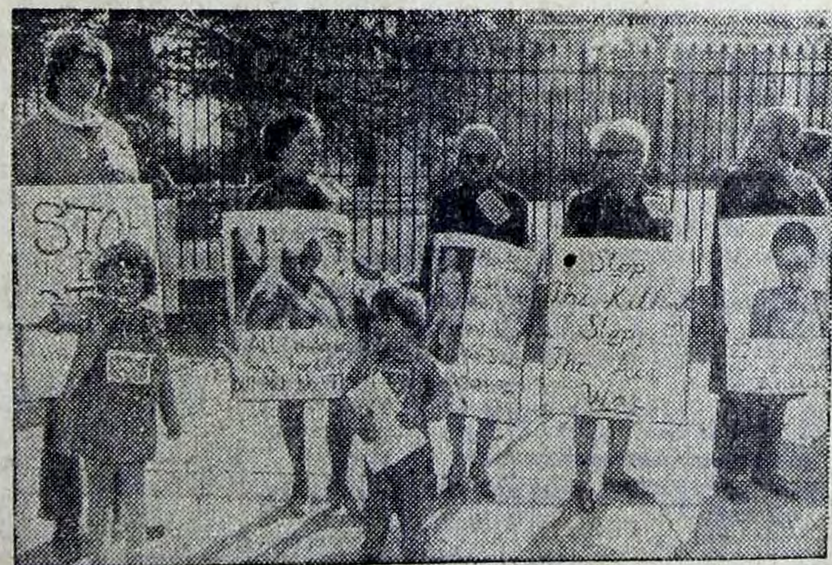
Вашингтон. «Вахтой мира» назвали эту манифестацию протеста против американской агрессии в Юго-Восточной Азии у Белого дома ее участницы — члены организации «Женщины, боритесь за мир».