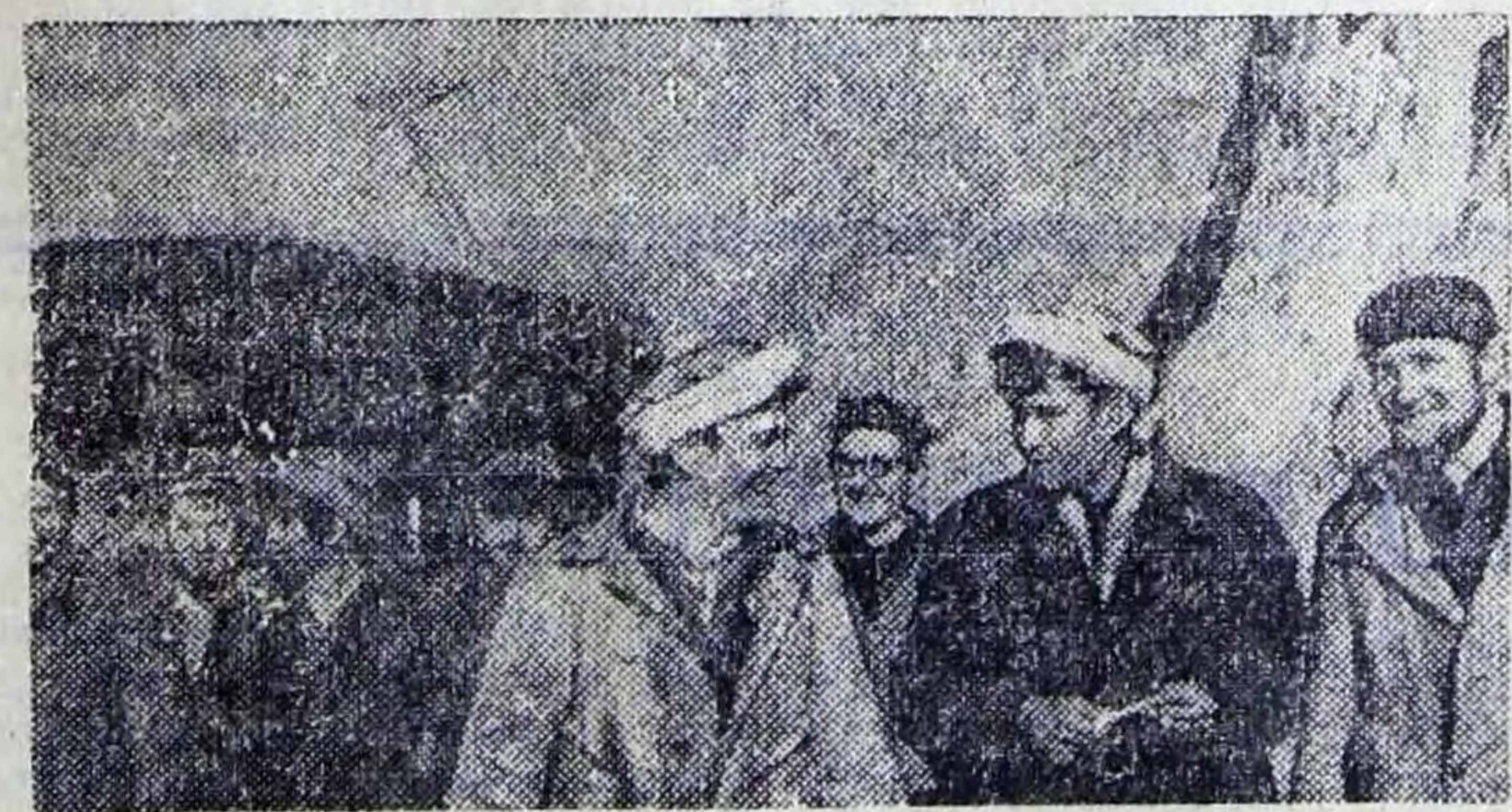
создать в республике мощную электростанцию. На снимке: комсомольско-

Строится самая крупная станция нового энергетического комплекса — высокогорная Токтогульская ГЭС. Это Всесоюзная ударная комсомольская стройка. Со всех концов страны приехала в Киргизию молодежь, чтобы