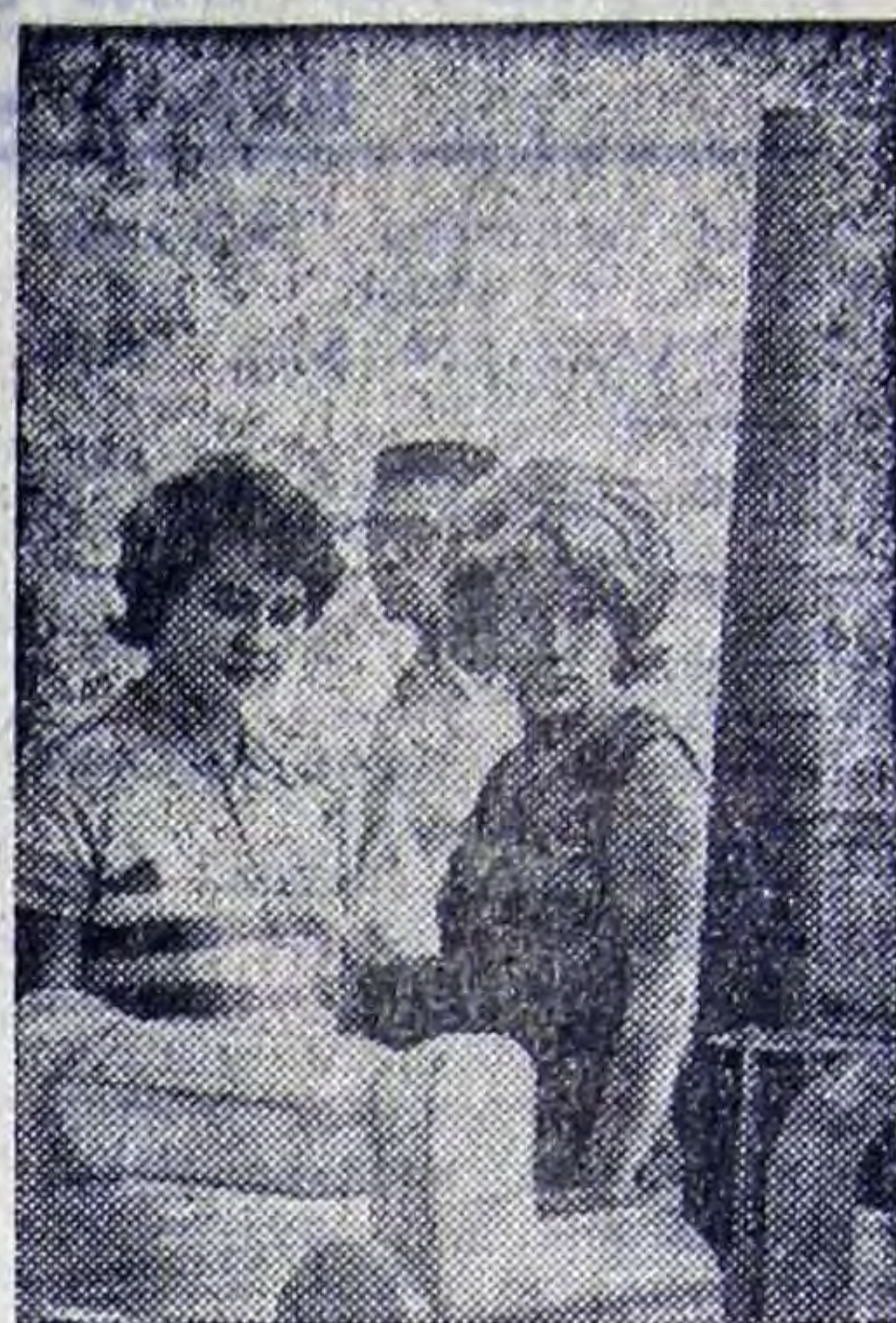
На снимке: ВДНХ, в павильоне «Охрана природы». Посетители у стенда Макеевского металлургического комбината. Очистные сооружения этого предприятия отличаются простотой конструкции, эффективной работой, они позволяют неоднократно использовать воду.