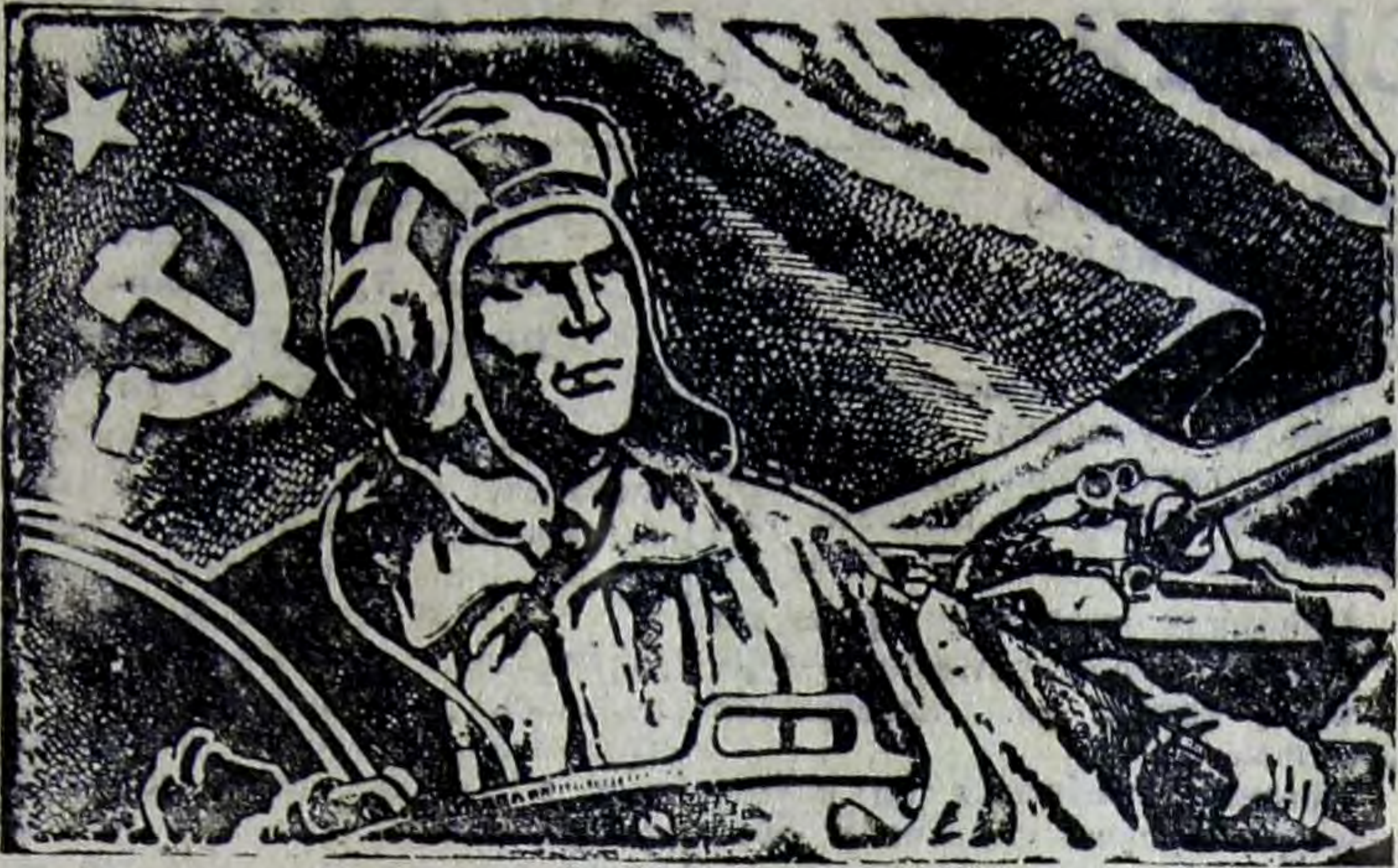
РИСУНОК С. ГРИНЬКО.