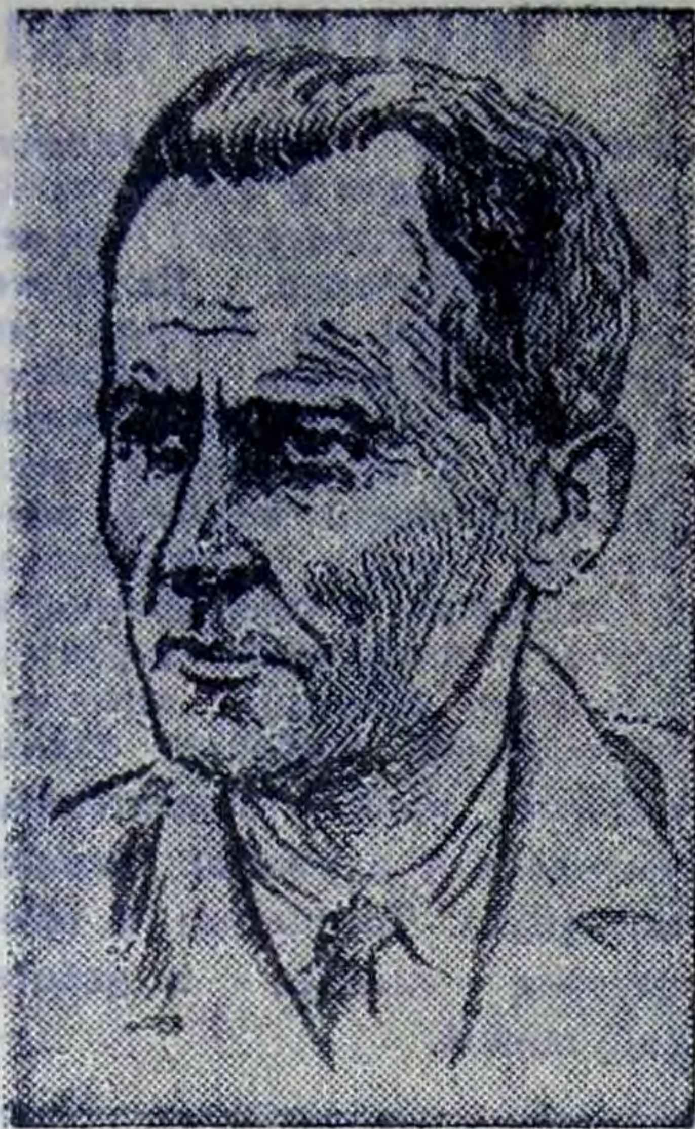
Арсеньева «По Уссурийскому краю», «Дерсу Узала», «В горах Сихотэ-Алинь», «Сквозь тайгу» и др. передавались много раз.

10 сентября исполняется 100 лет со дня рождения известного исследователя Дальнего Востока Владимира Клавдиевича Арсеньева (1872—1930). Он предпринял целый ряд сложнейших экспедиций, посвященных изучению Дальнего Востока, природных богатств, жизни и обычаев его коренного населения. Исследовал горную область Сихотэ-Алинь, считавшуюся до того «белым пятном» на географической карте, совершил с научной целью путешествия на Камчатку и Командорские острова.