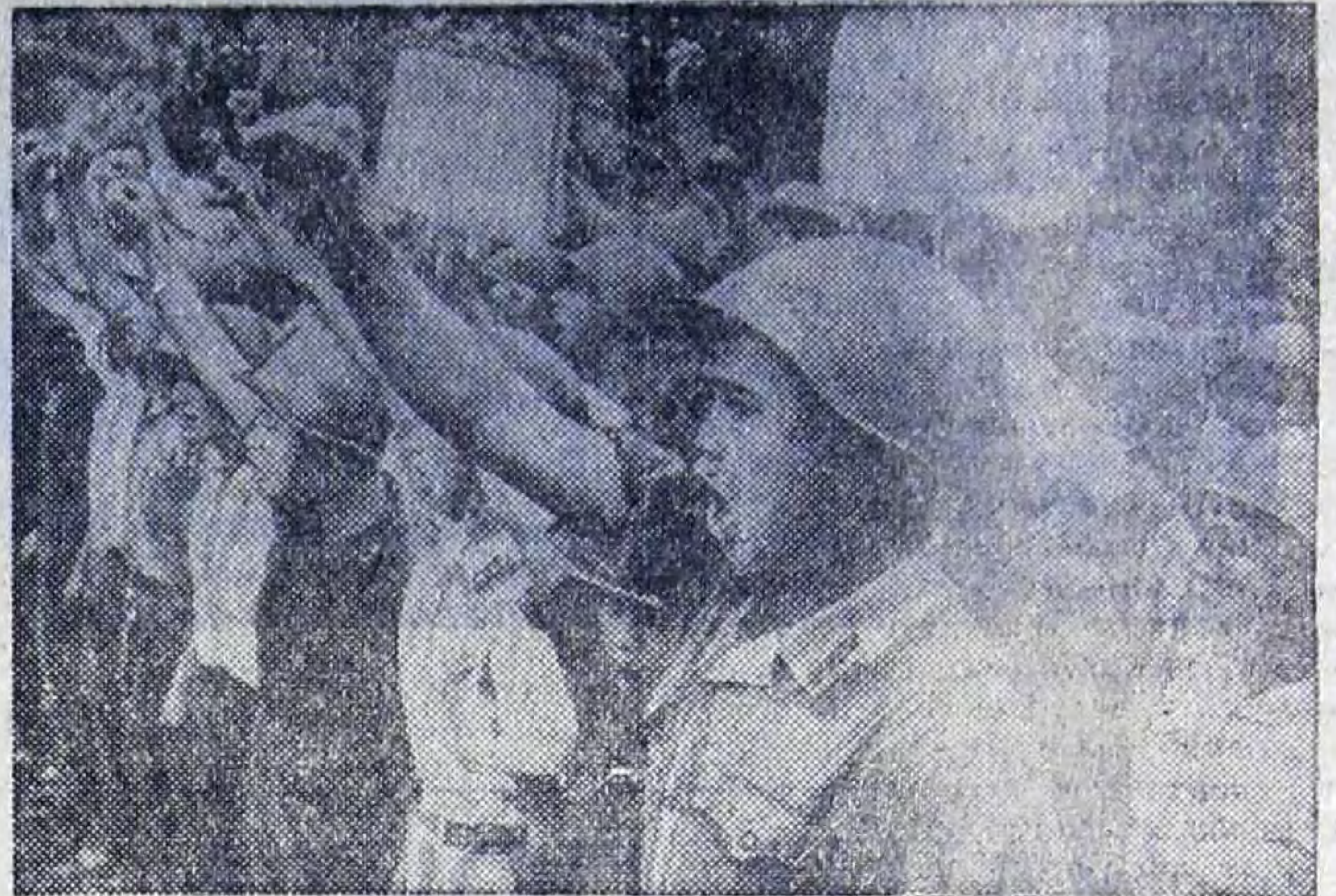
ДРВ. Бойцы противозвоздушной обороны Хайфона клянутся отомстить американским агрессорам за кровь и слезы народа Вьетнама.