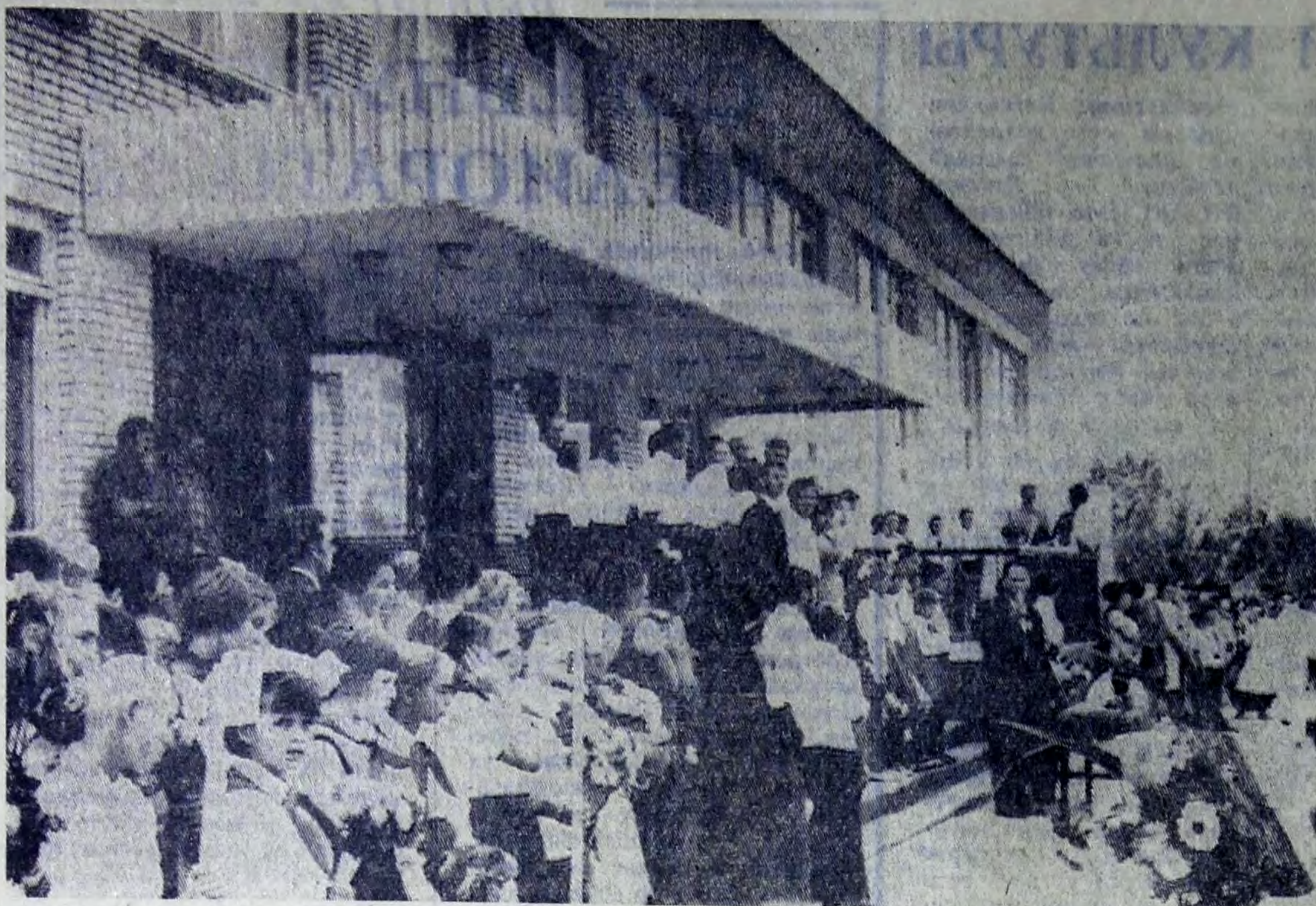
Торжественное открытие школы № 10.