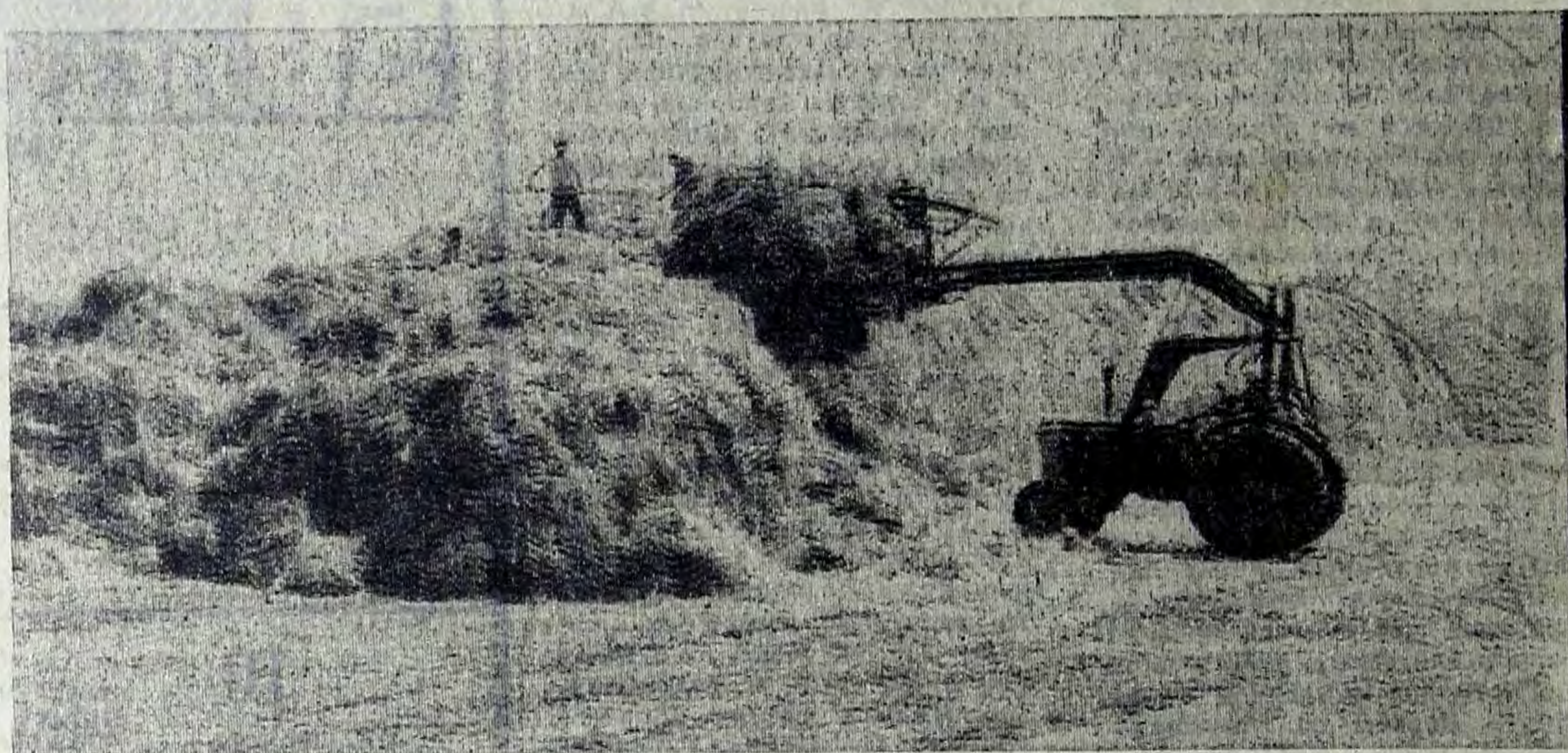
В колхозе имени Свердлова поставлена задача — все грубые корма завести в сжатые сроки непосредственно на кормовые базы при животноводческих фермах.

Парткому повседневно оказывать помощь профсоюзной и комсомольской организациям, партийным организациям по дальнейшему развитию социализации, воспитания у рабочих, инженерно-технических работников и служащих высокого чувства ответственности за освоение новых видов продукции, прогрессивной технологии, высокопроизводительного оборудования, научной организации труда, культуры и эстетики производства, привлекая для этой цели политинформаторов, агитаторов, лекторов общества «Знание», руководящих и инженерно-технических работников.