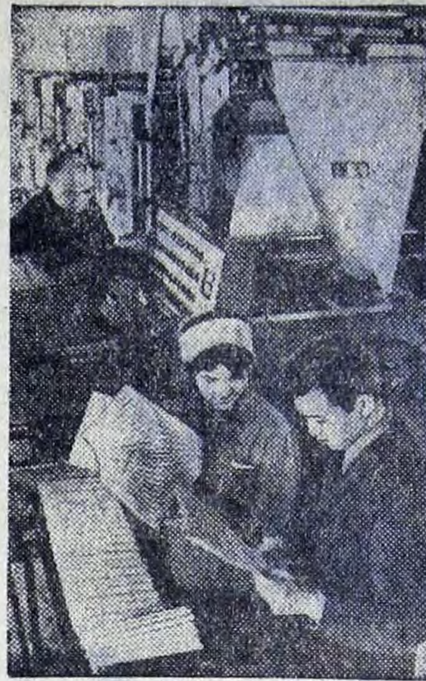
В столице Казахстана издается множество книг, более 20 газет и журналов на казахском, уйгурском и русском языках. В городе работают пять больших издательств с мощной полиграфической базой.

И хотя Алма-Ата расположена за тысячи километров от морей, а тем более океанов, в недалеком будущем ее смогут называть прибрежным городом. Всего в 70 километрах от нее сейчас наполняется рукотворное море Капчагайской ГЭС на реке Или. Предлагается также открыть кратчайший путь к «киргизскому морю» — красивейшему в Средней Азии озеру Иссык-Куль. Для этого инженеры предлагают пробить в горах тоннель и проложить монорельсовую дорогу длиной 70 километров.