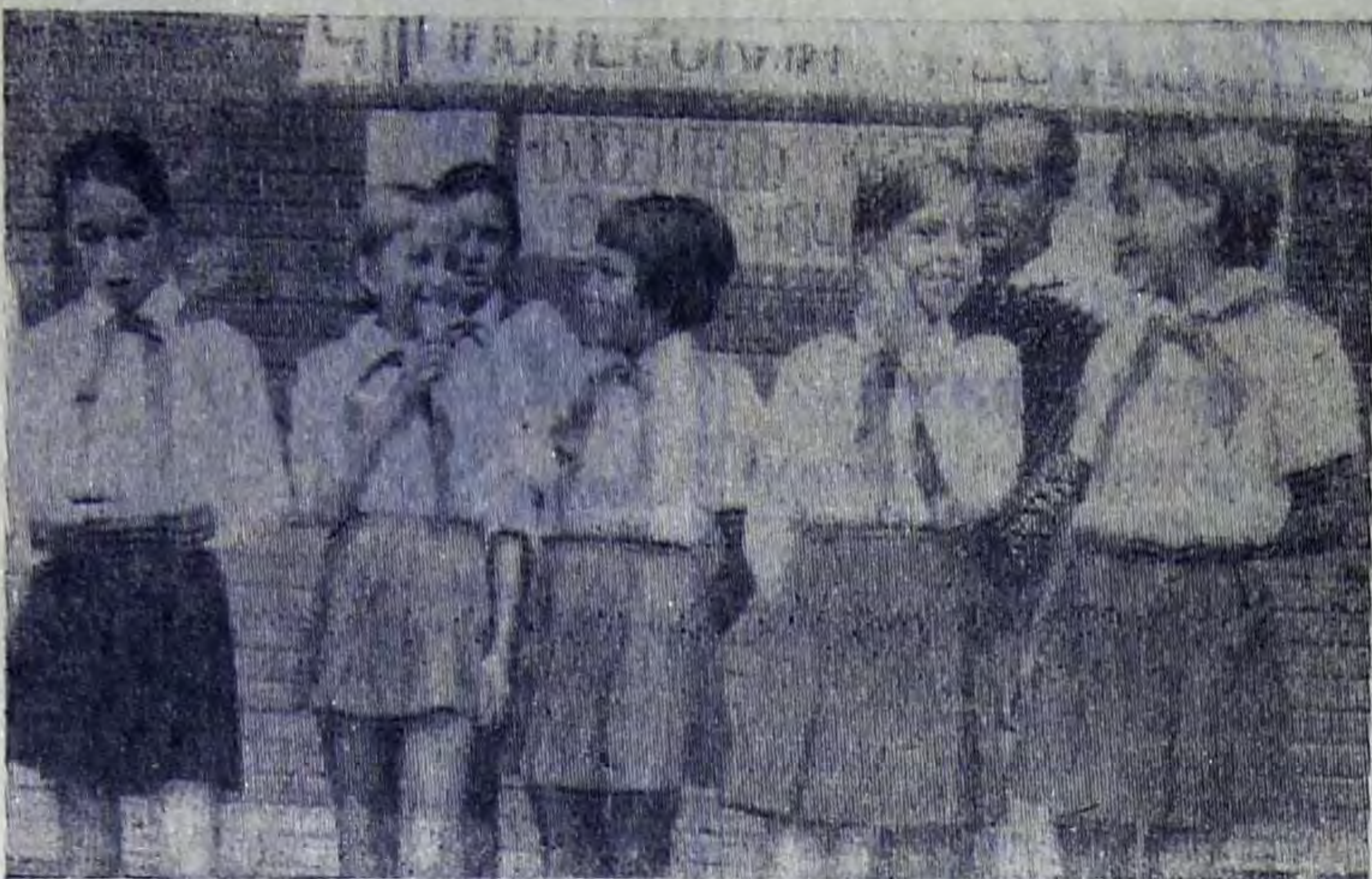
Недавно на эстрадной площадке пионерского лагеря «Орленок» состоялся праздничный концерт «Дружба народов». Пионеры из трех лагерей — «Орленок», «Ласточка», «Колос» — исполняли песни и пляски народов нашей страны.