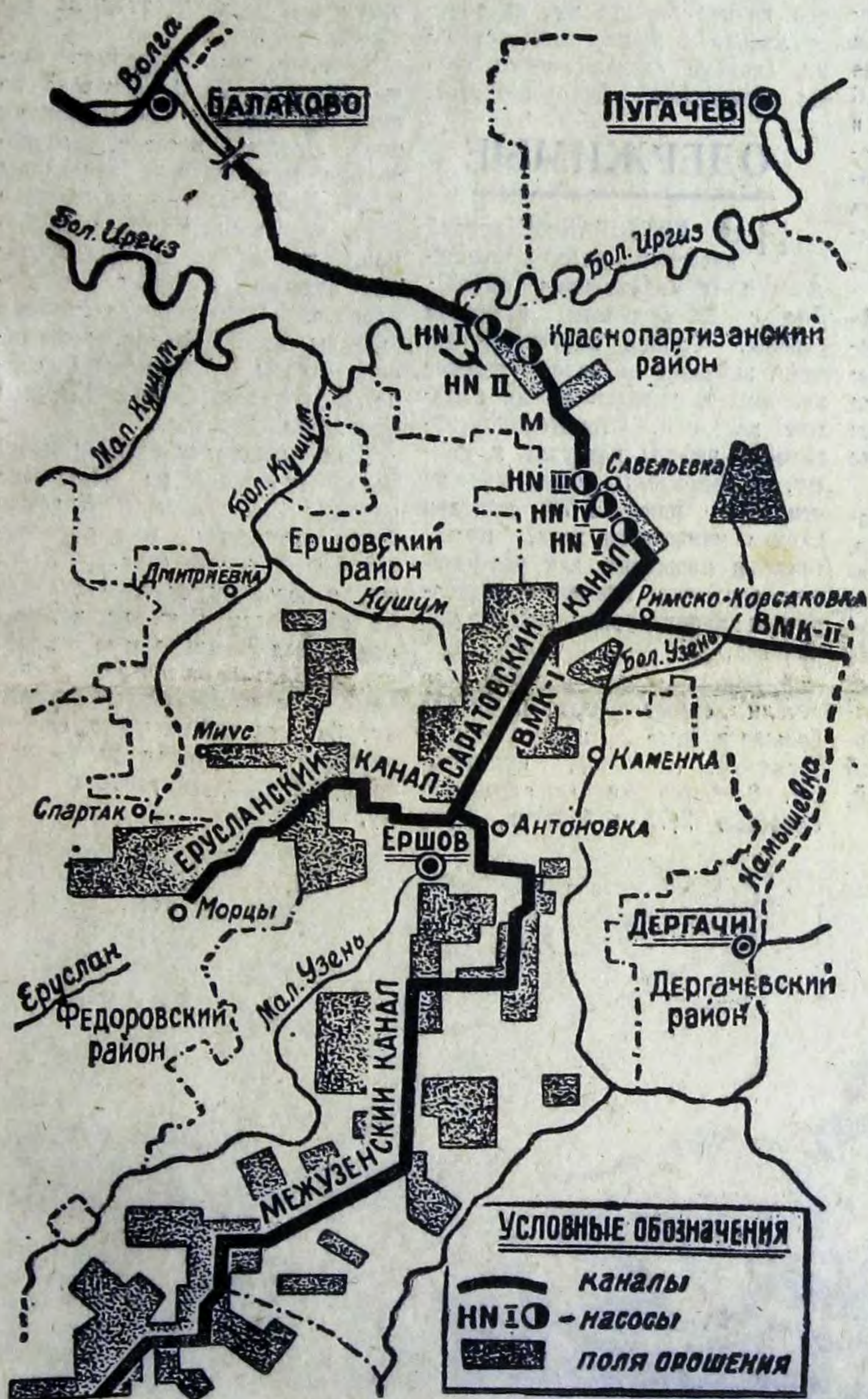
Схема Саратовского оросительно-обводнительного канала.