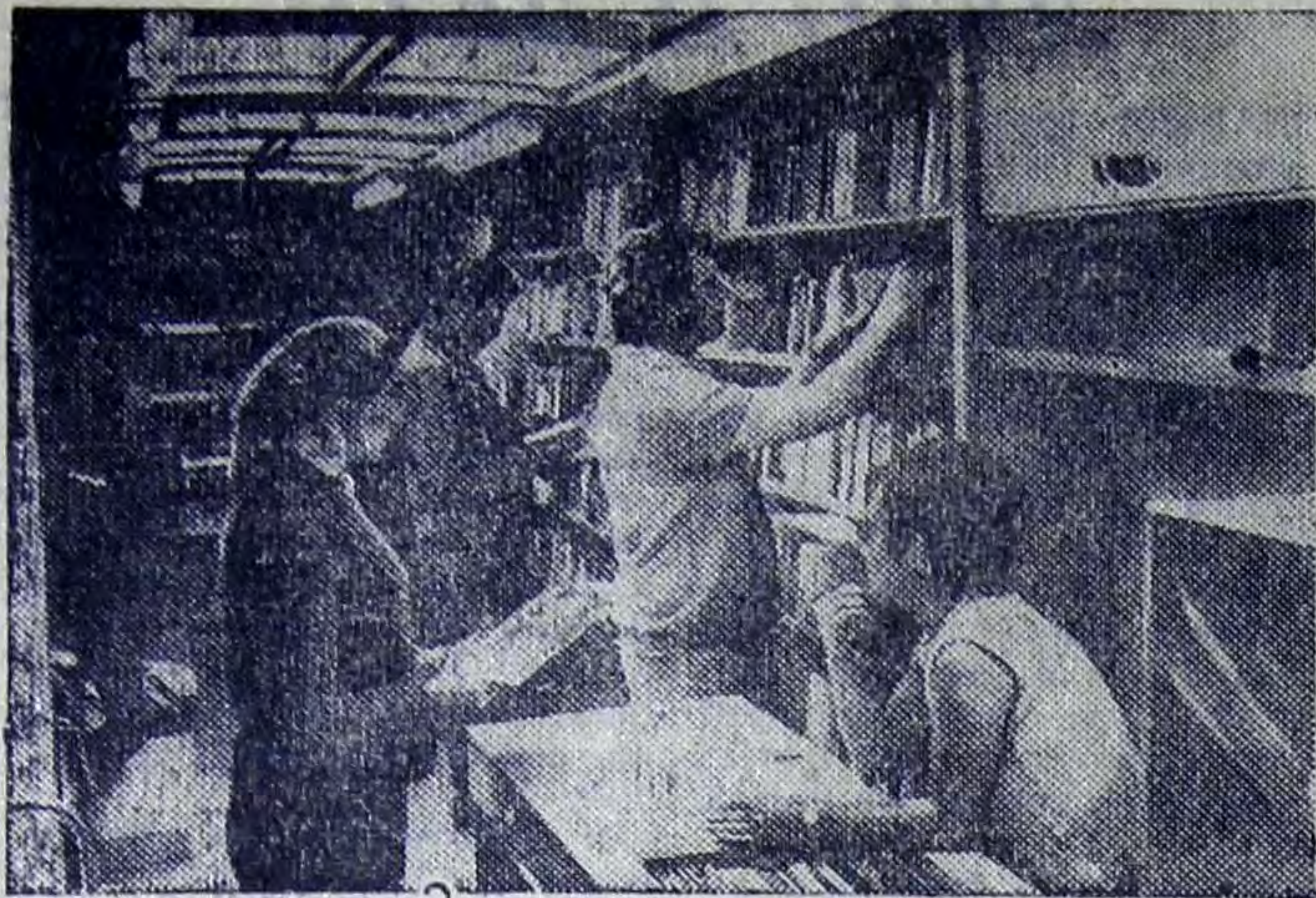
Если городская библиотека далеко, «культура» доставляется «на колесах». Этот вид обслуживания тружеников сельского хозяйства хорошо налажен в Нойбранденбурге — аграрном районе на севере Германской Демократической Республики. Передвижная библиотека шефствует над кооперативами и народными именными.