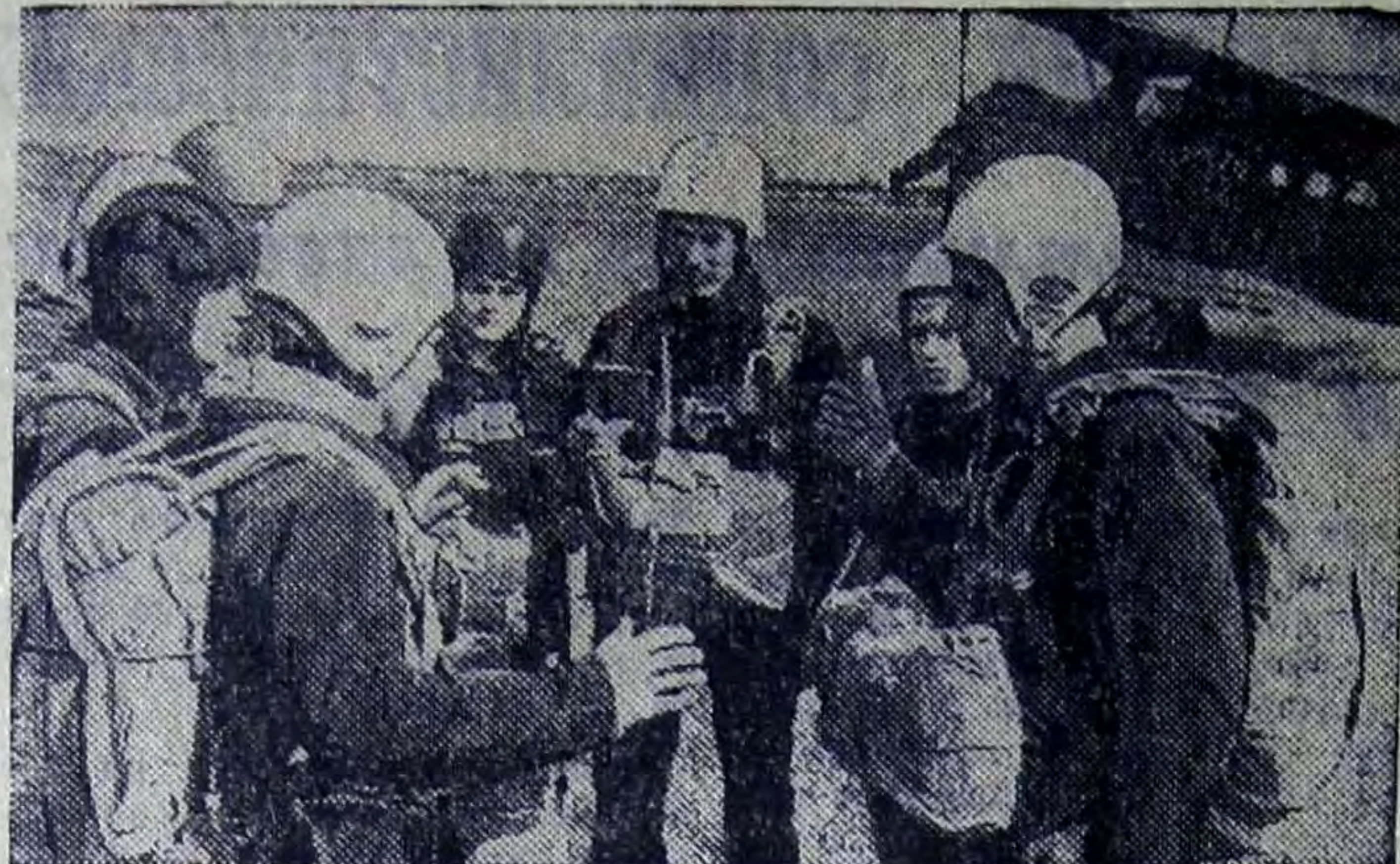
Рабочие Южно-Уральского машиностроительного завода, рабочие и служащие других предприятий, молодежь — несколько сот спортсменов занимаются в аэроклубе ДОСААФ города Орска, в Оренбургской области.

Авиаконструкторы и инженеры чехословацкого авиационного завода «Мораван» в Отроковице сконструировали и построили новый одномоторный одноместный самолет «З-526-АФС», предназначенный для выполнения фигур высшего пилотажа (на снимке).