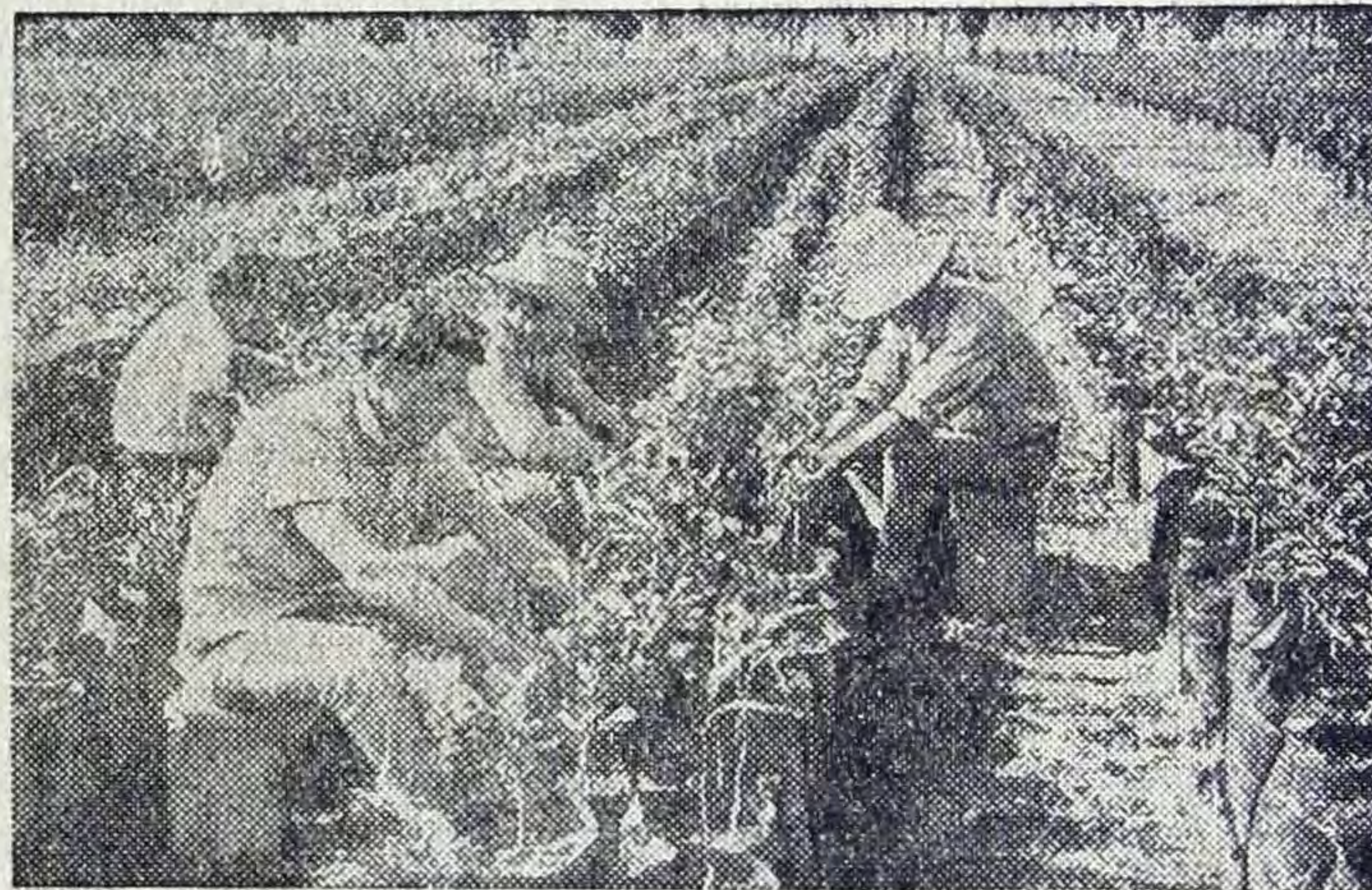
КУБА. Остров Пинос становится крупнейшим производителем цитрусовых.