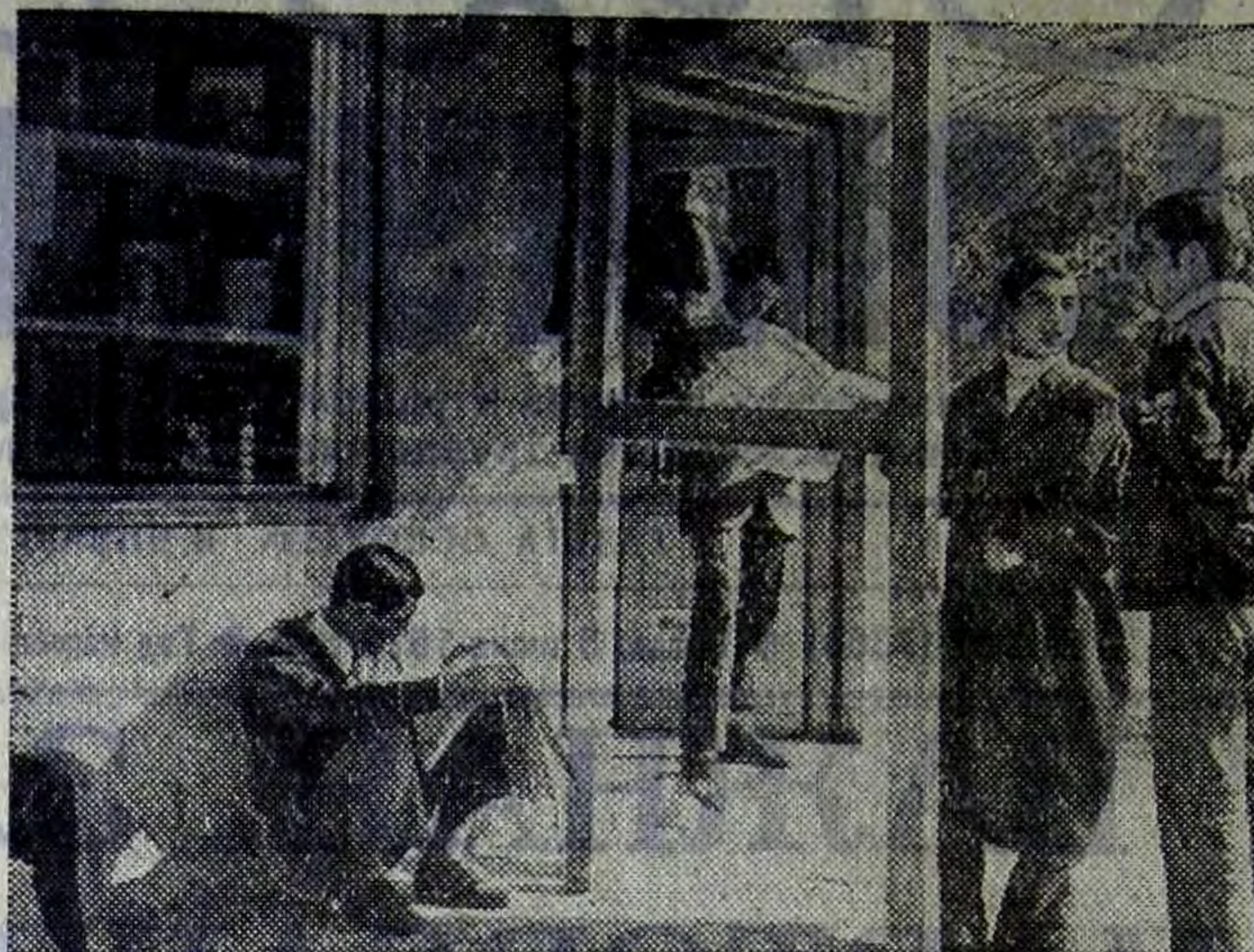
Алжирская Народная Демократическая Республика. У книжной лавки в городе Бискра. Жители знакомятся с последними новостями.