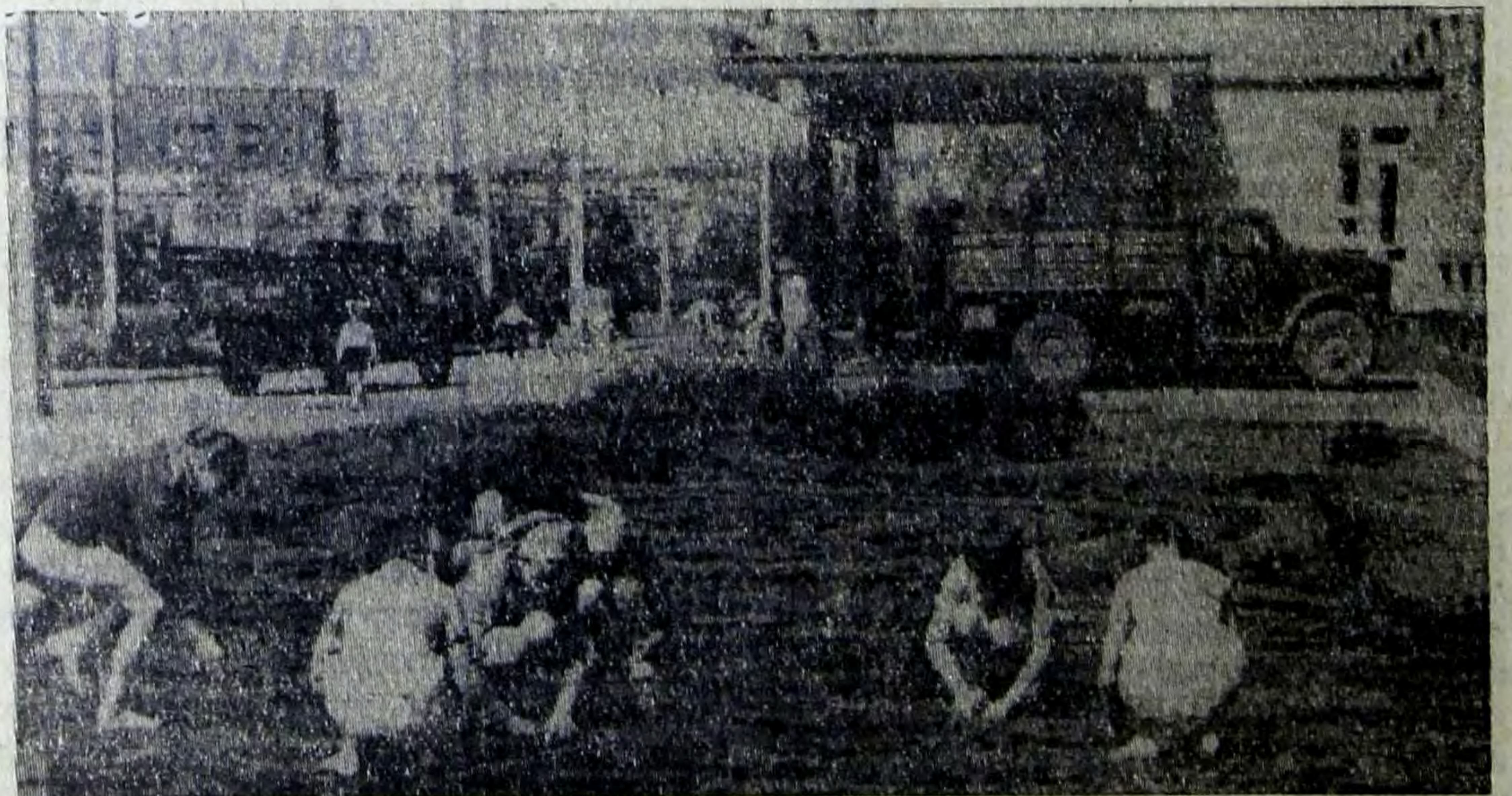
На снимке: учащиеся 5-х классов школы № 3 на пришкольном участке.