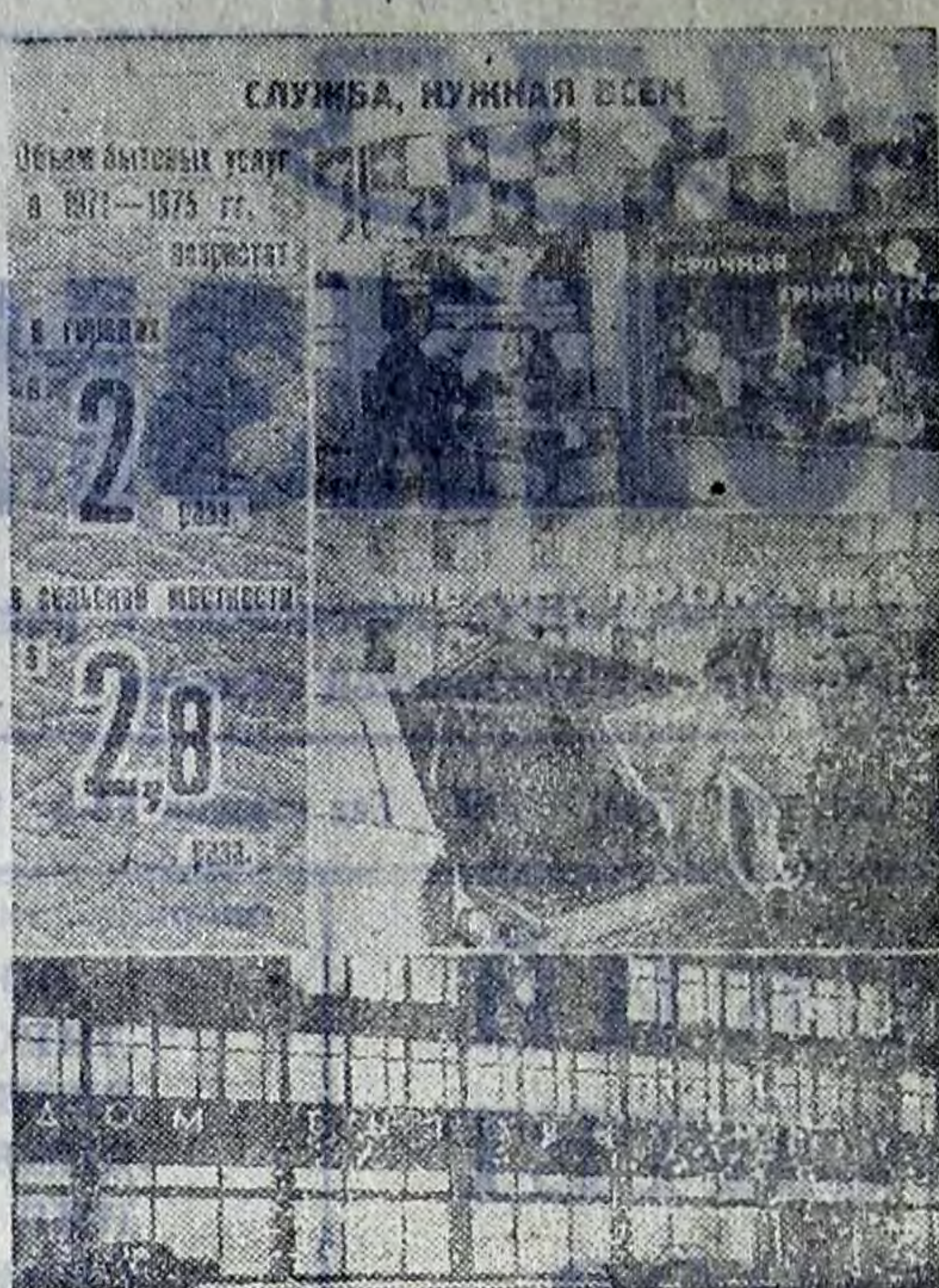
Объем бытовых услуг.