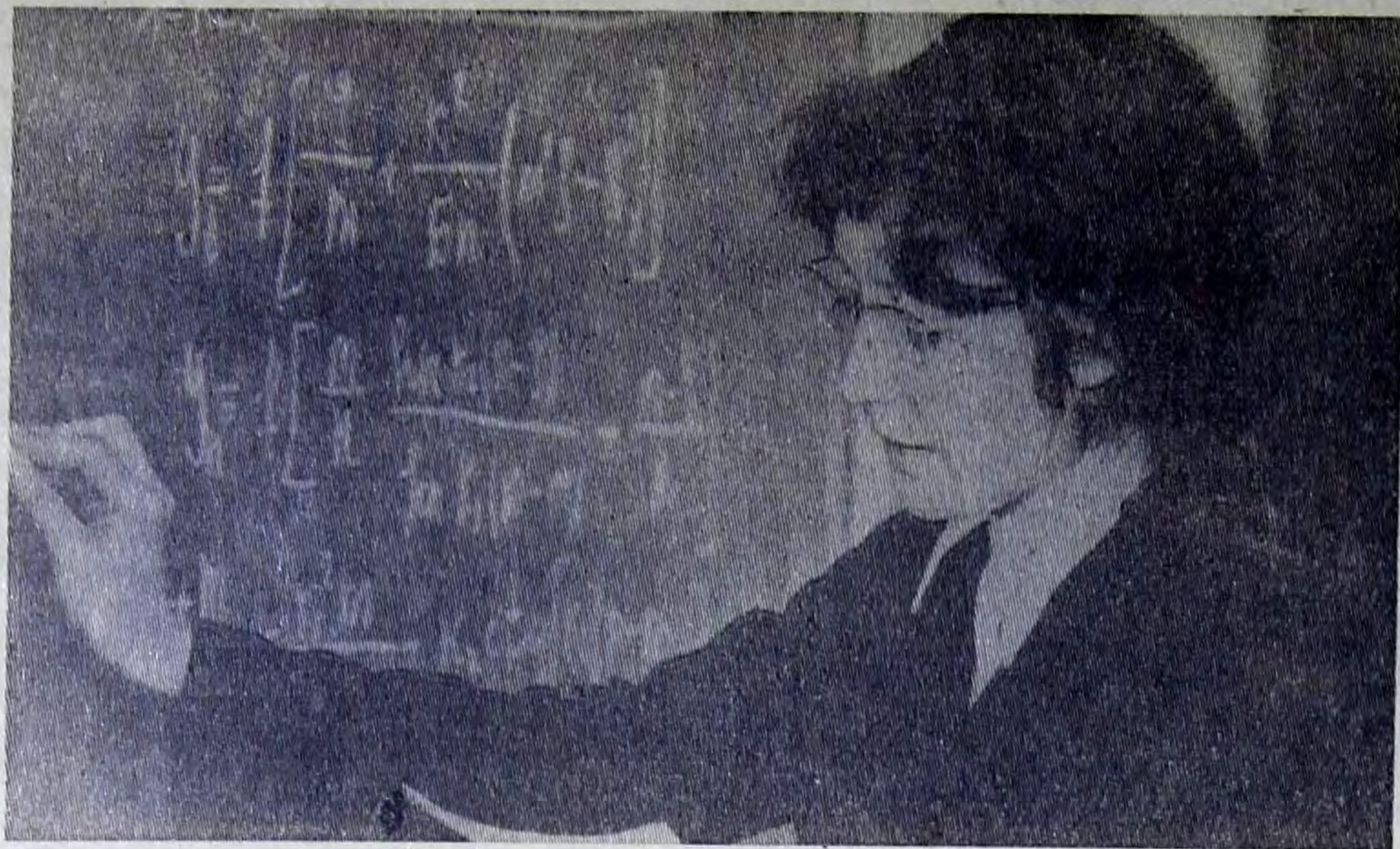
На балаковском общетехническом факультете ежегодно проводятся научно-технические конференции. На них заслушивают наиболее интересные доклады членов студенческого научно-технического общества.