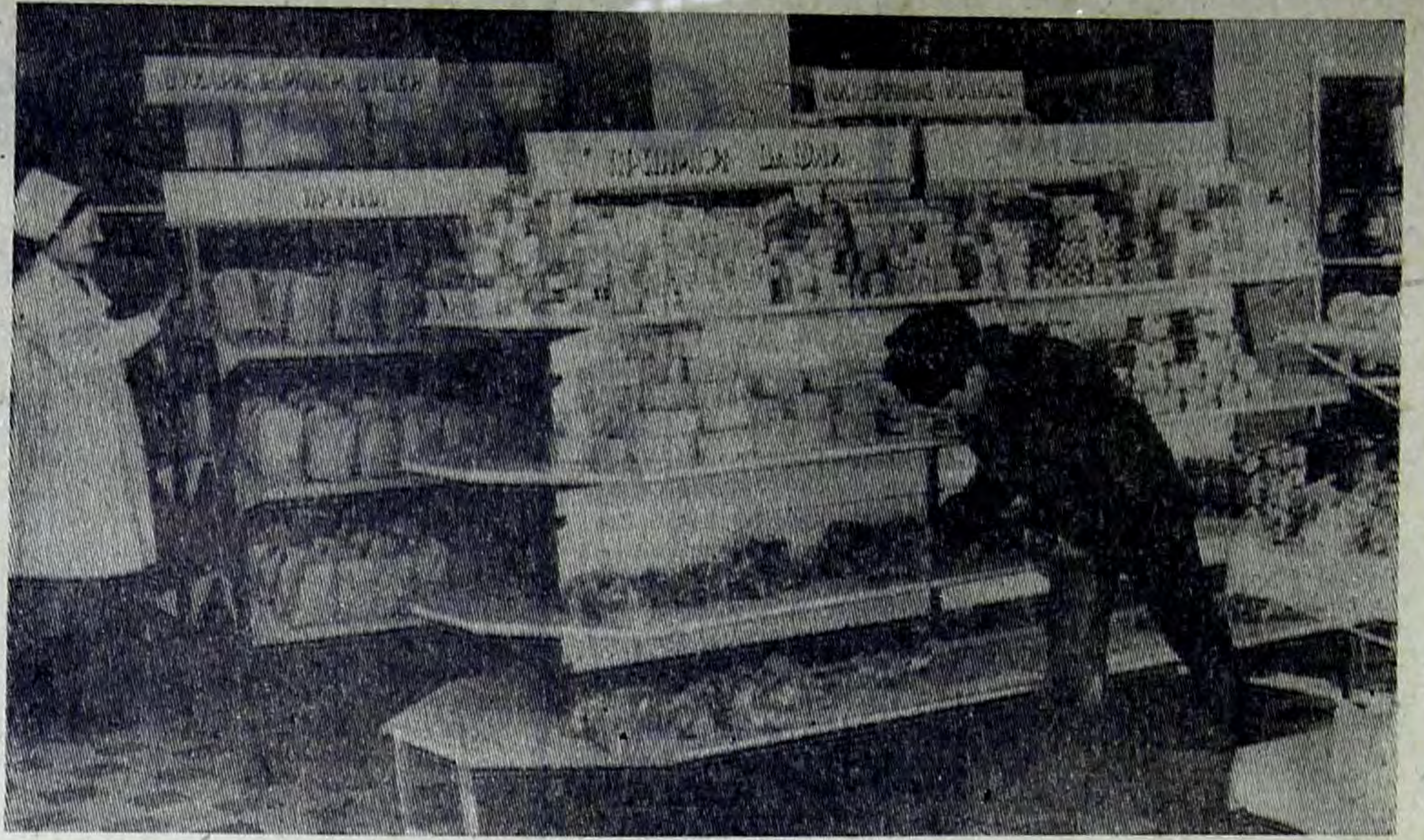
Недавно открылся второй по счету продовольственный магазин самообслуживания городского торгового центра на улице Заречной.

Такой метод торговли покупателям одобряют, потому что затраты времени на приобретение продуктов намного сокращаются.