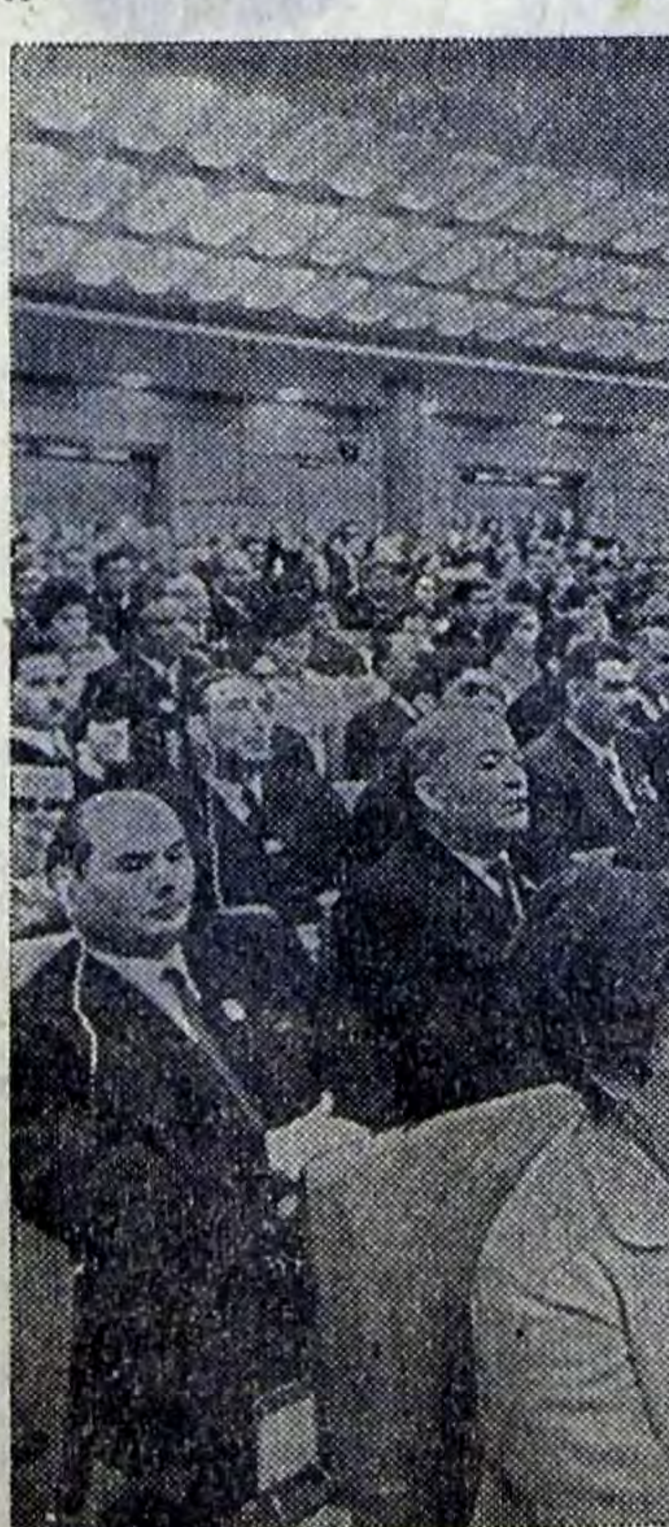
Москва. XXIV съезд КПСС. На снимке: в зале Кремлевского Дворца съездов во время заседания.