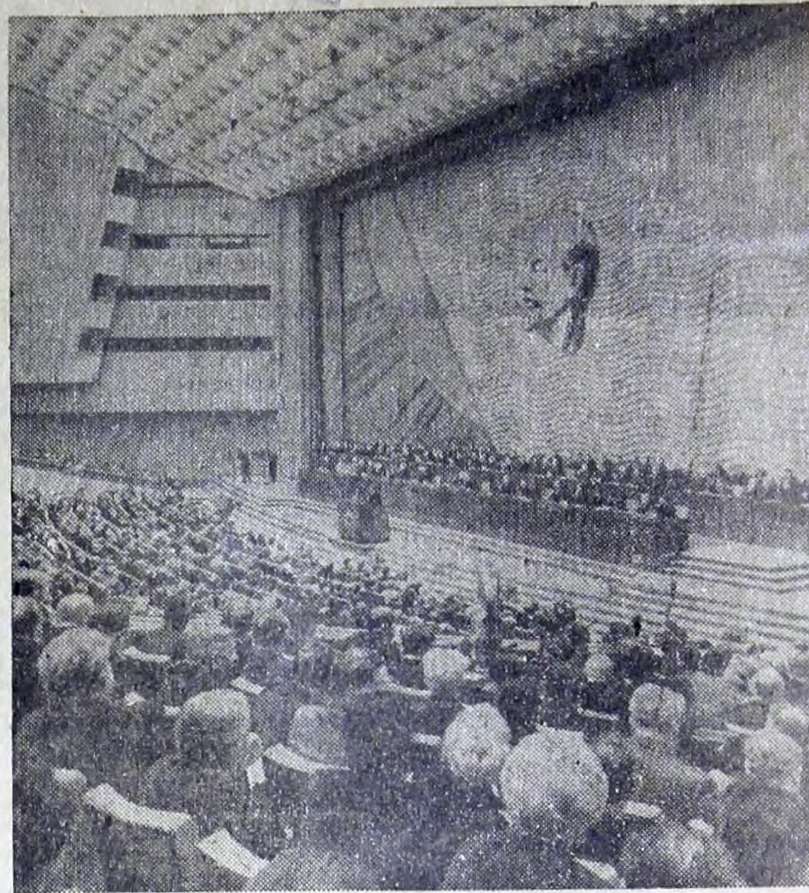
Москва. XXIV съезд КПСС.

На снимке: в зале Кремлевского Дворца съездов во время заседания.