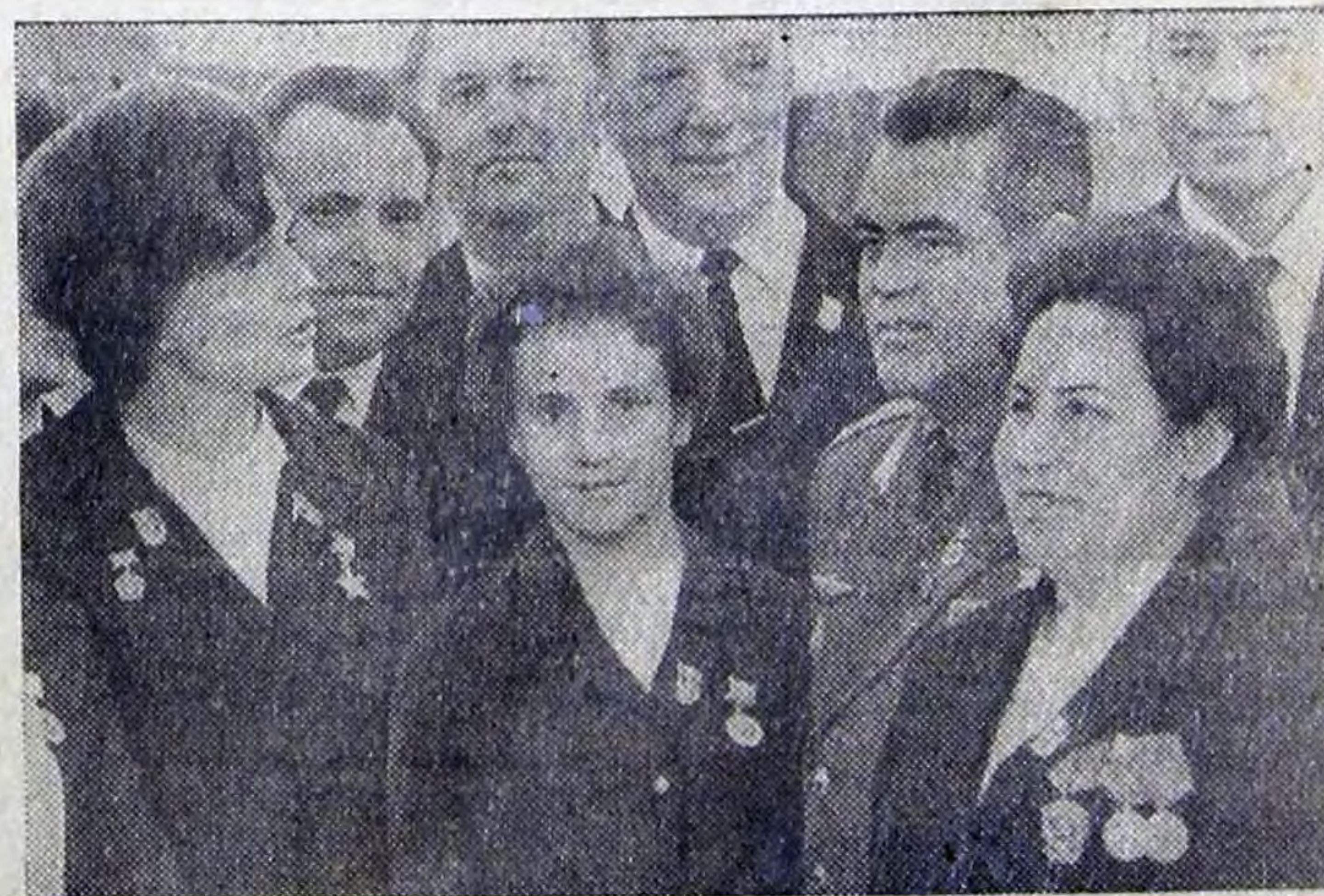
Москва. XXIV съезд КПСС. На снимке: летчики-космонавты СССР Герой Советского Союза В. В. Николаева-Терешкова и дважды Герой Советского Союза