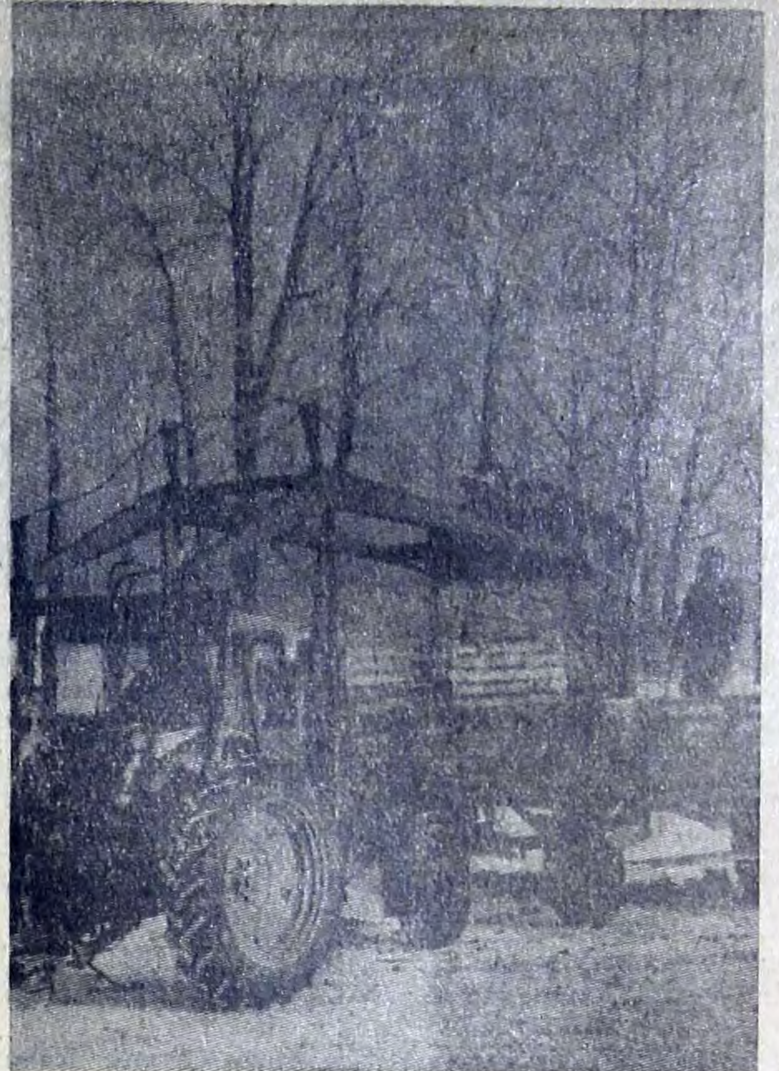
Механизаторы первой комплексной бригады колхоза «Заветы Ильича» решили получить высокий урожай всех культур и сейчас активно ведут подготовку к весеннему севу.

Закончен ремонт прицепного инвентаря, готовятся тракторы, семена, накапливаются минеральные удобрения. Три тракторных агрегата ежедневно заняты вывозкой на поля навоза. Более тысячи тонн этого ценного удобрения уже вывезено на плантации и пары. До весны механизаторы наметили вывезти в поле еще 2 тысячи тонн удобрений.