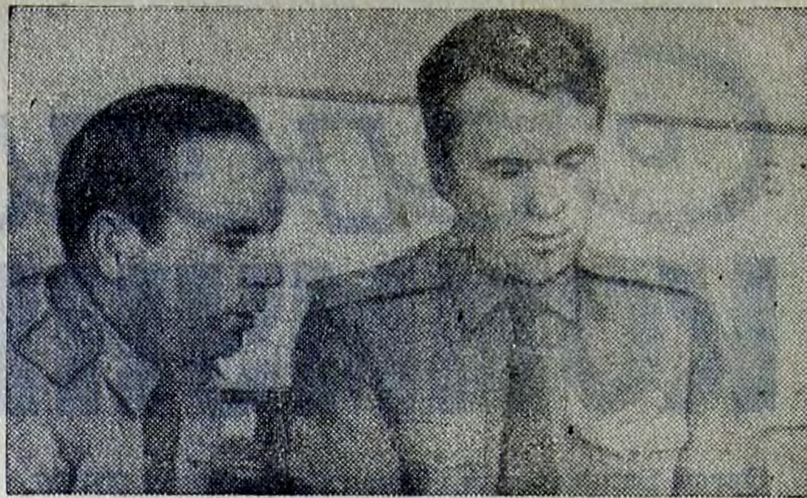
На снимке: летчики-космонавты СССР В. В. Горбатко и В. А. Шаталов на командном пункте, с которого поддерживается связь с первой пилотируемой орбитальной научной станцией «Салют».