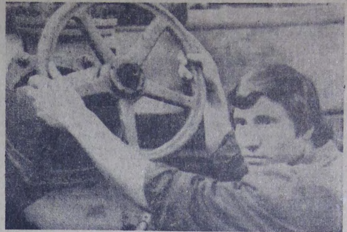
Аппаратчик штапельного производства комбината химического волокна комсомолец

№ 61 (6902) ● Среда, 15 апреля 1970 года ● Год издания 53-й ● Цена 2 коп.