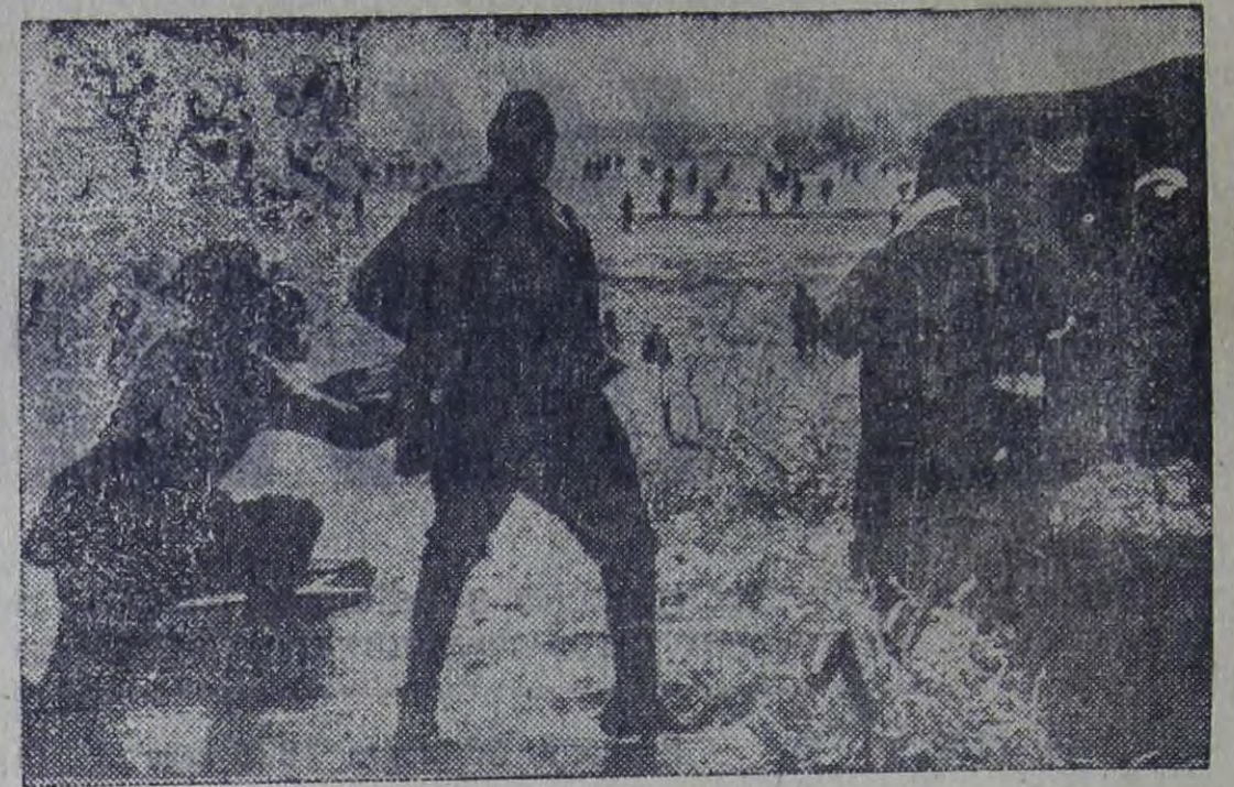
Великая Отечественная война. Бой в излучине Дона.