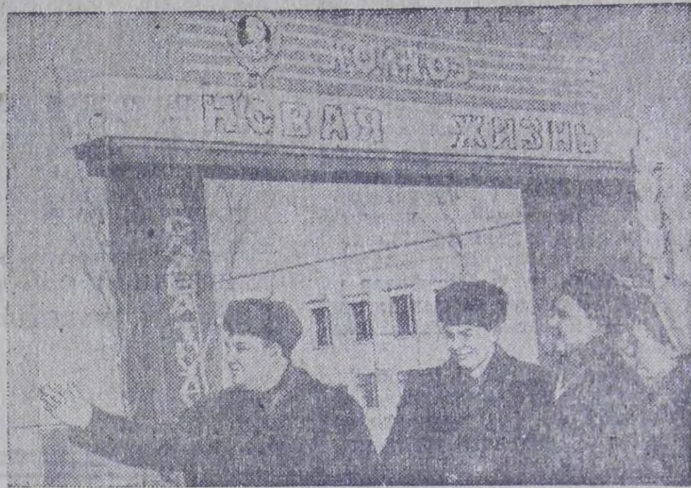
Орден Ленина колхоз «Новая жизнь» (Щекнинский район) — один из передовых в Тульской области. В минувшем году доход его составил более двух миллионов рублей.

Перенимать опыт в колхоз приезжают много делегаций из разных областей страны.