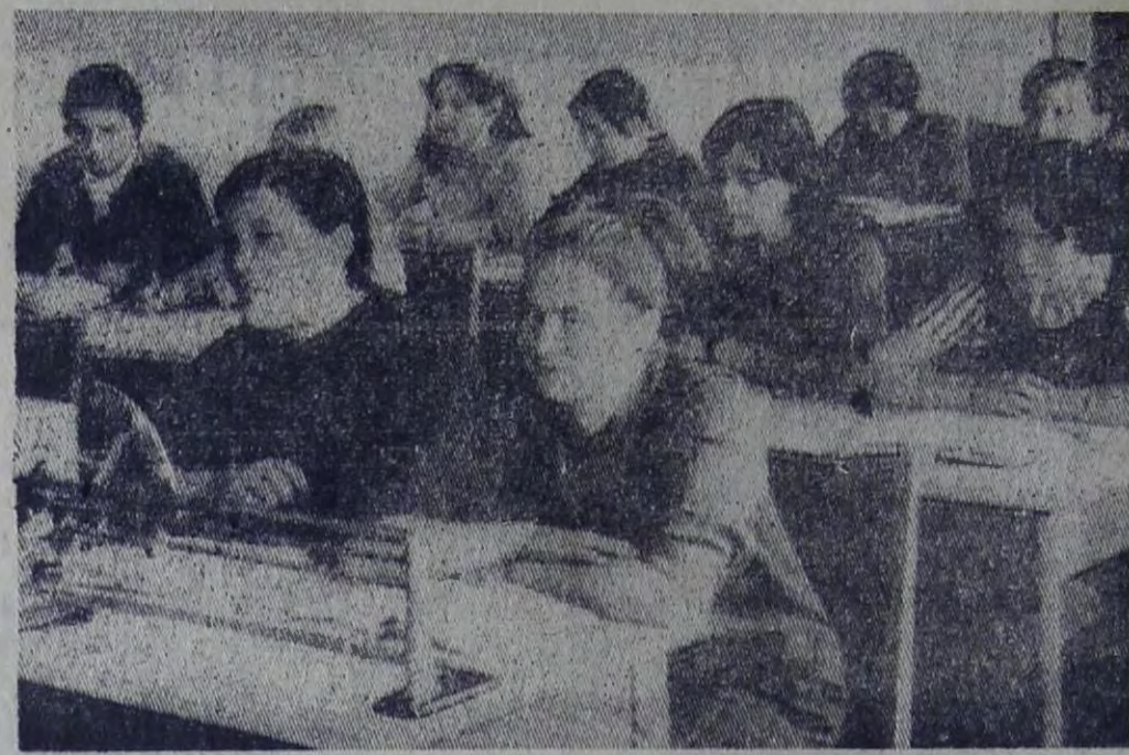
На уроке по спецтехнологии.