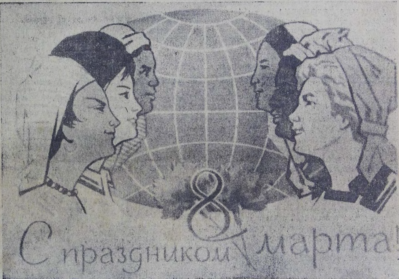
Худ. Е. Соловьев (издательство «Советский художник»).