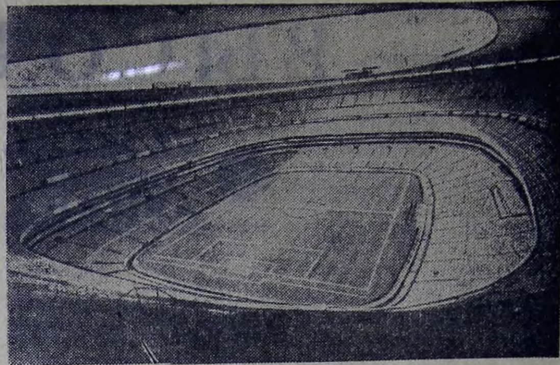
Мехико. Стадион «Ацтек». Здесь 31 мая 1970 года матчем сборных СССР и Мексики начнется IX первенство мира по футболу. На этом стадионе будут проведены все игры команд первой группы, в которую входит советская команда, а также ряд других матчей, в том числе полуфиналы и финал.