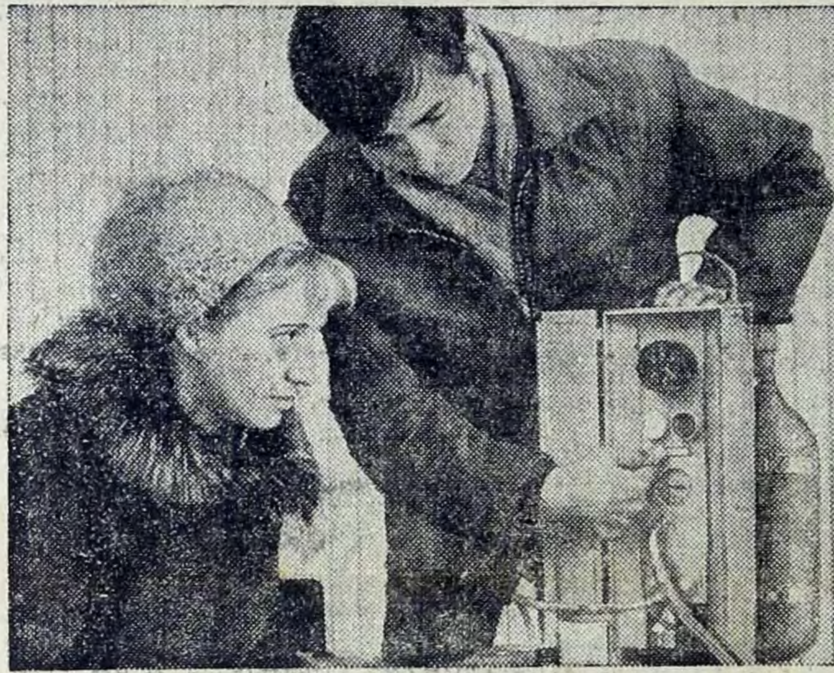
Редактор В. Д. ДЕЛАШИНСКИЙ