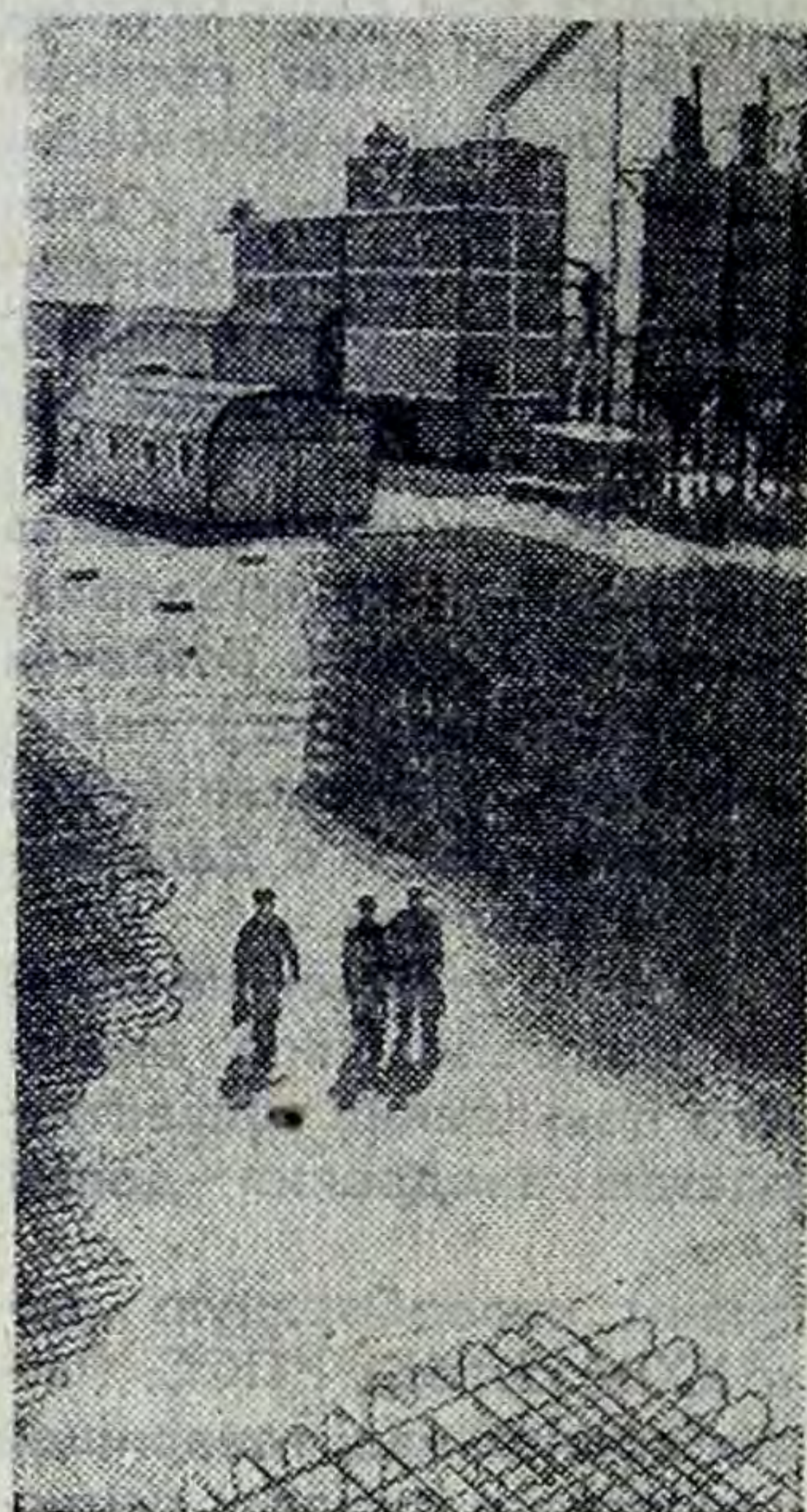
Туркменская ССР. Недалеко от Мары, на берегу Каракумского канала, раскинулась огромная строительная площадка. Здесь сооружается крупнейшая в республике электростанция.

Мощность нового энергетического гиганта превысит 1 миллион 350 тысяч киловатт. Его агрегаты будут работать на природном газе разведанных близости богатейших месторождений. На снимке: автоматический бетонный завод Марыской ГРЭС. Его мощность — 35 тысяч кубометров бетона в год.