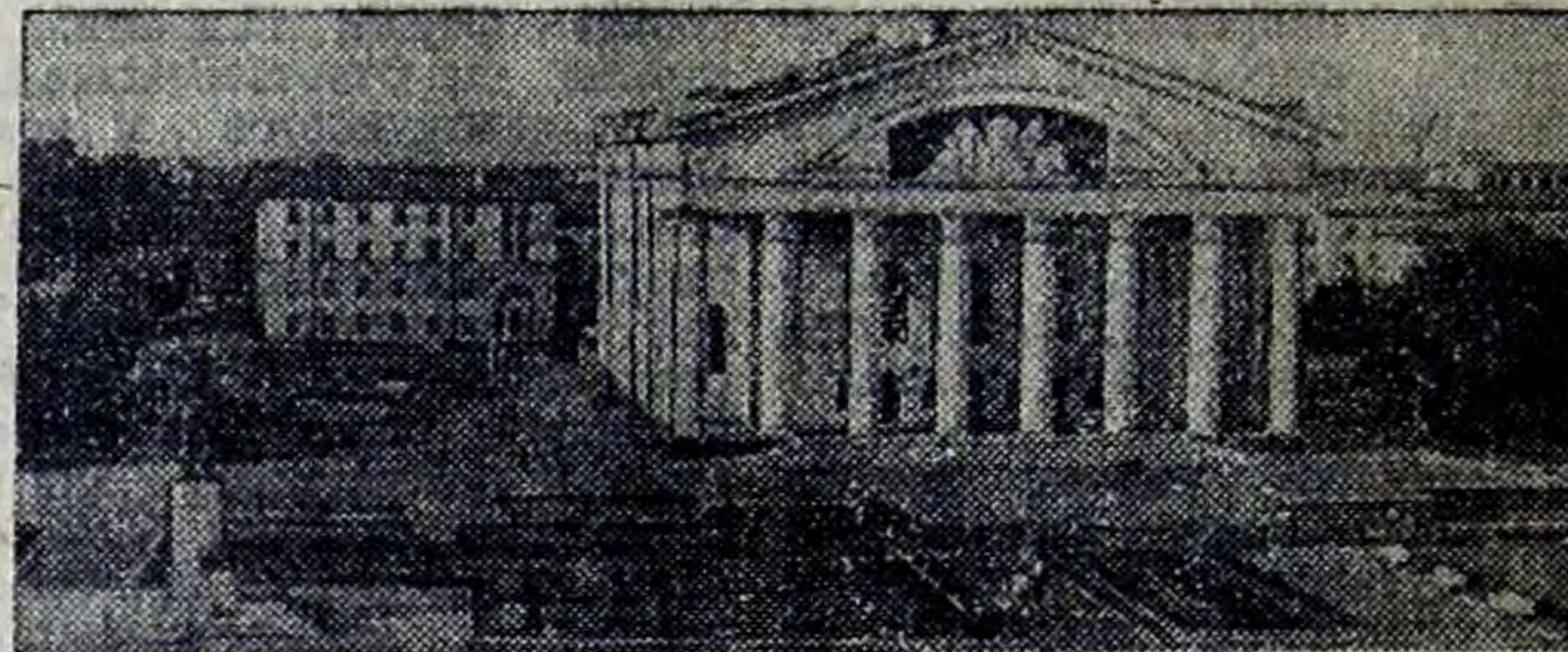
Марийская АССР. Столица республики — Йошкар-Ола. Площадь имени Ленина.

4 ноября исполняется 50 лет со дня получения автономии марийцами, удмуртами и калмыками. Только с победой Великой Октябрьской социалистической революции, впервые в истории эти ранее отсталые народы получили национальную государственность, началось их возрождение. За полвека Советской власти трудящиеся Марийской, Удмуртской и Калмыцкой АССР достигли больших успехов в развитии промышленности, сельского хозяйства, культуры. Сейчас они вносят достойный вклад в дело строительства коммунизма в нашей стране.