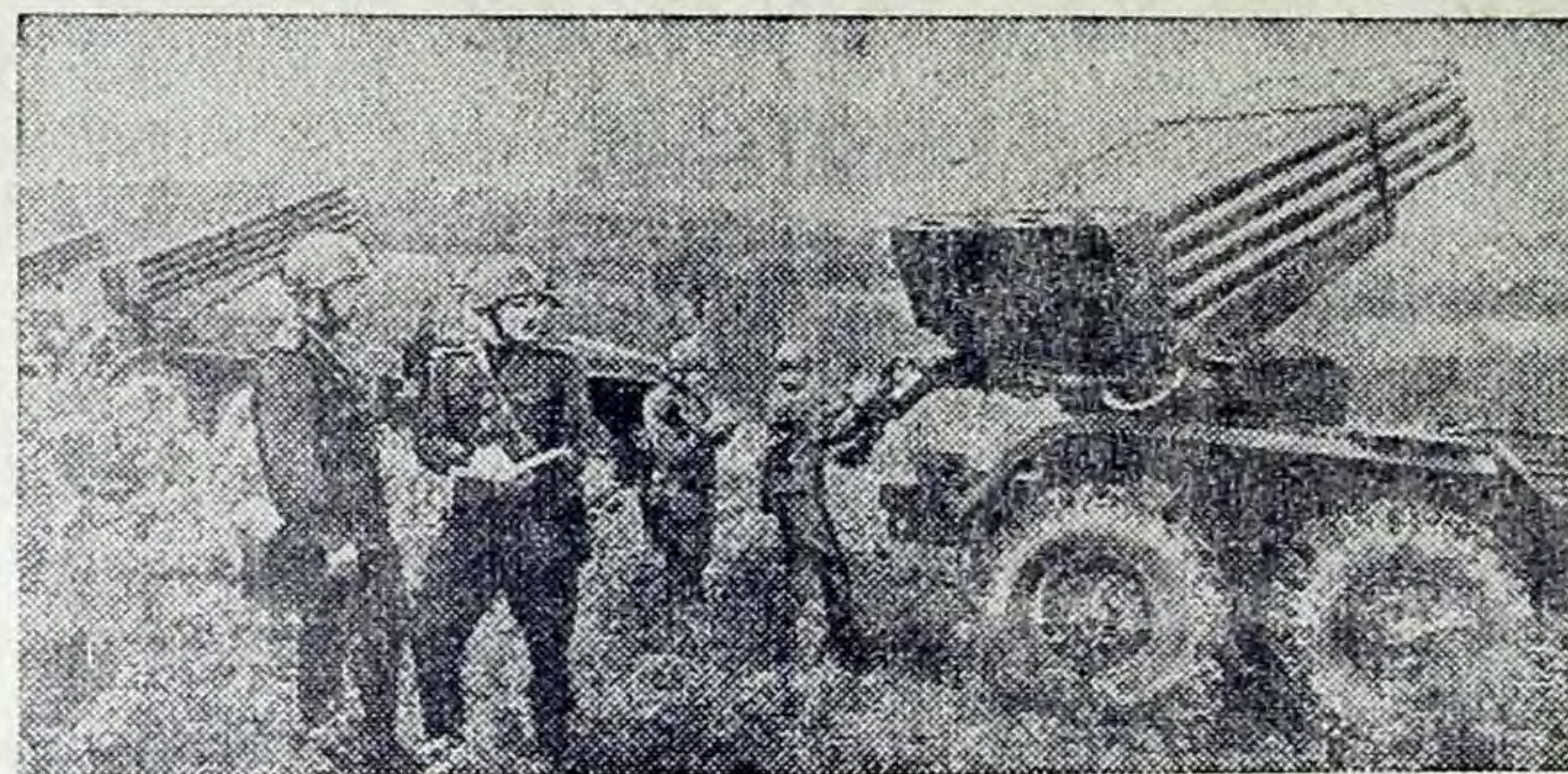
БУДНИ СОВЕТСКОЙ АРМИИ

На учениях, в условиях, наиболее приближенных к боевым, войска тренируются совершать