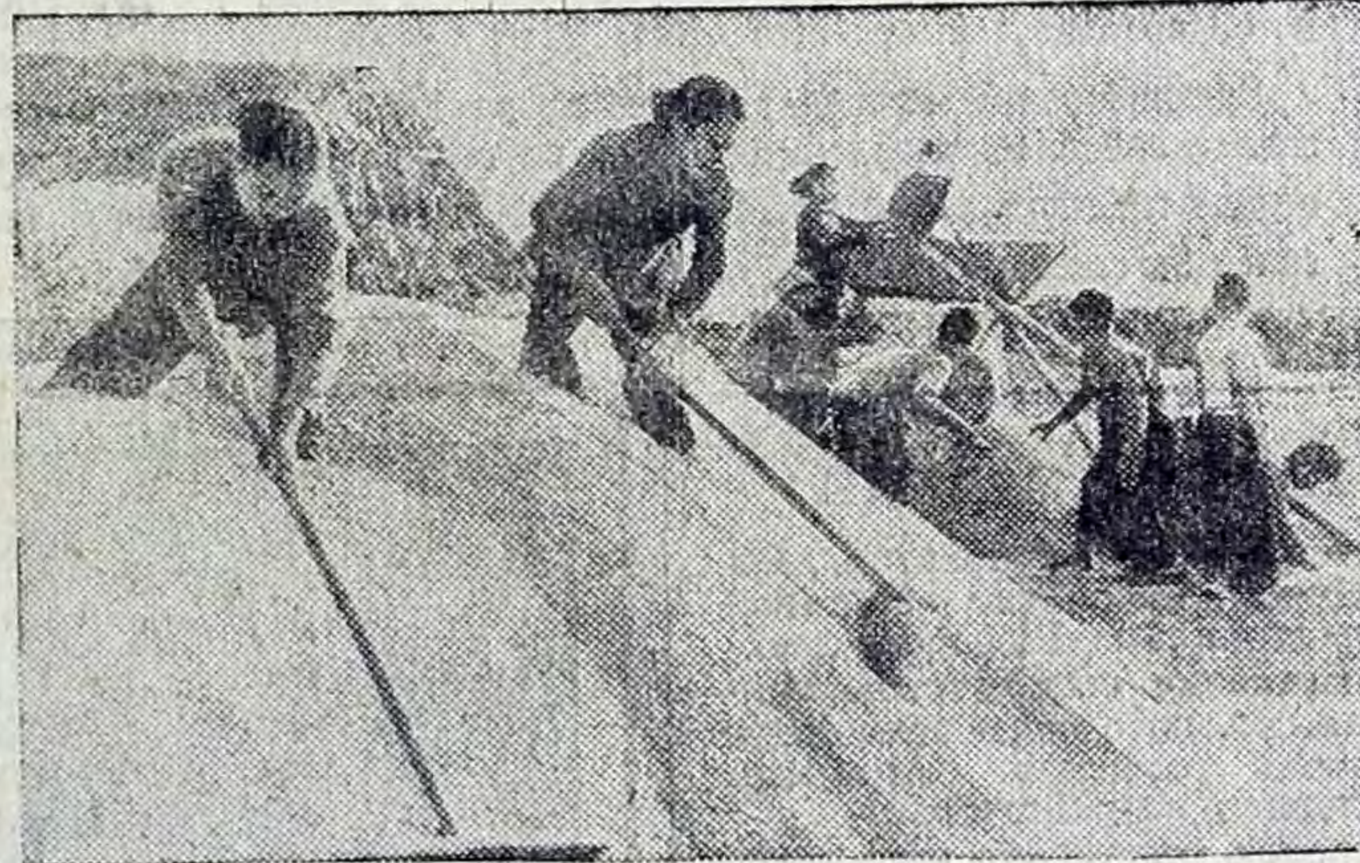
ДРВ. У рисоводов провинции Тхайбинь. Этот снимок сделан на току в кооперативе Ву Тханг. Крестьяне этого района собрали рекордный урожай — 5 тонн риса с гектара.

Указ президента Гири ознаменовал новую крупную победу демократических сил Индии над правой реакцией. В. МАТЯШ, корреспондент ТАСС.