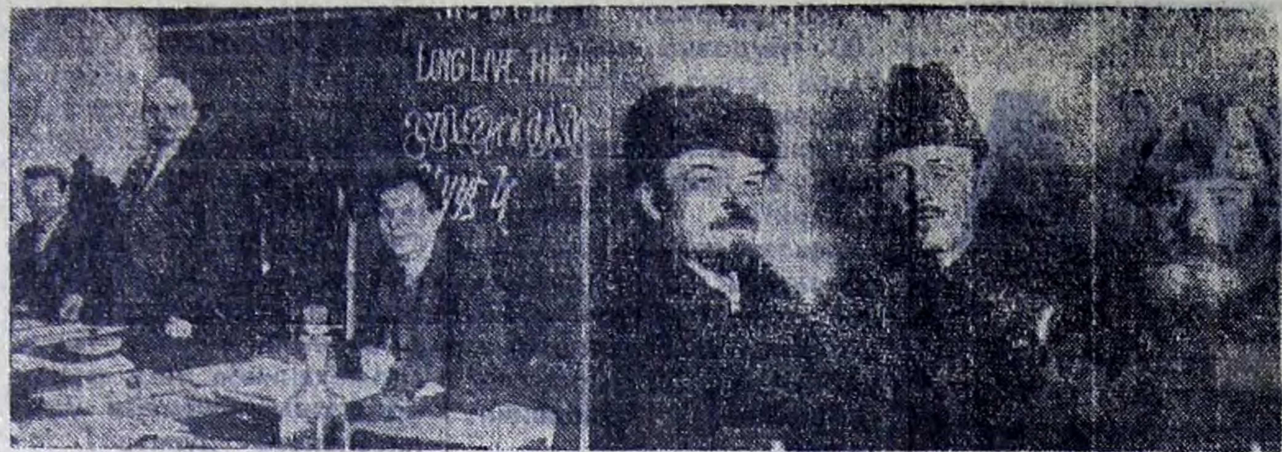
В. И. Ленин в президиуме I конгресса Коминтерна в Кремле. Слева направо: Г. Эберлейн, В. И. Ленин и Ф. Платтен. Москва, 2-6 марта 1919 года.