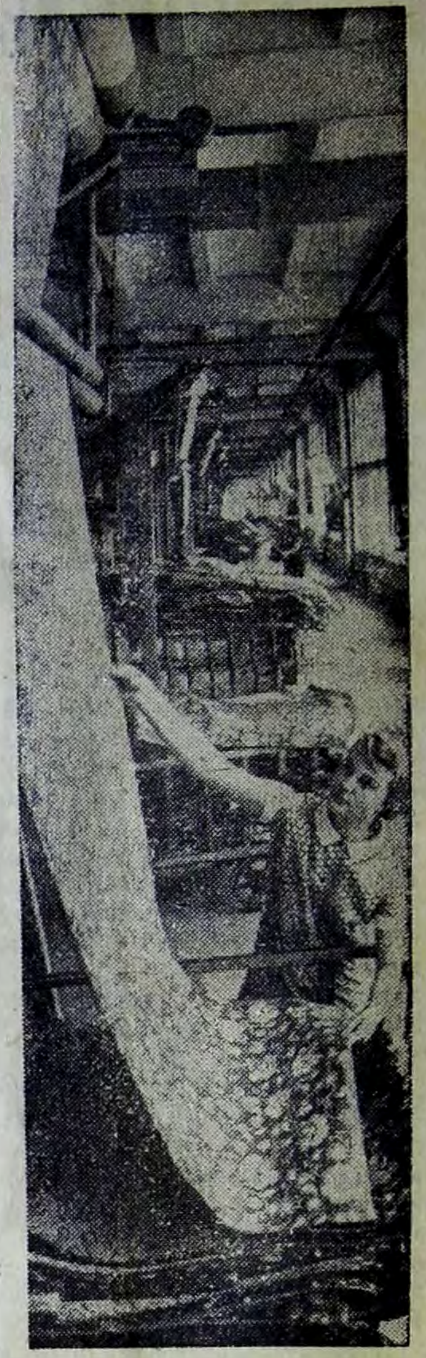
Волгоградская область. С вводом в эксплуатацию механизированного печатного производства фабрики К...

БАЛАКОВСКИЙ ФИЛИАЛ Саратовского головного завода ремонта бытовой техники ПРИГЛАШАЕТ НА РАБОТУ часовых мастеров, слесарей по ремонту бытовой техники. Оплата труда сдельная. Обращаться по адресу: 3-й микрорайон, набережная Леонова, 31, павильон «Мечта». 3-2