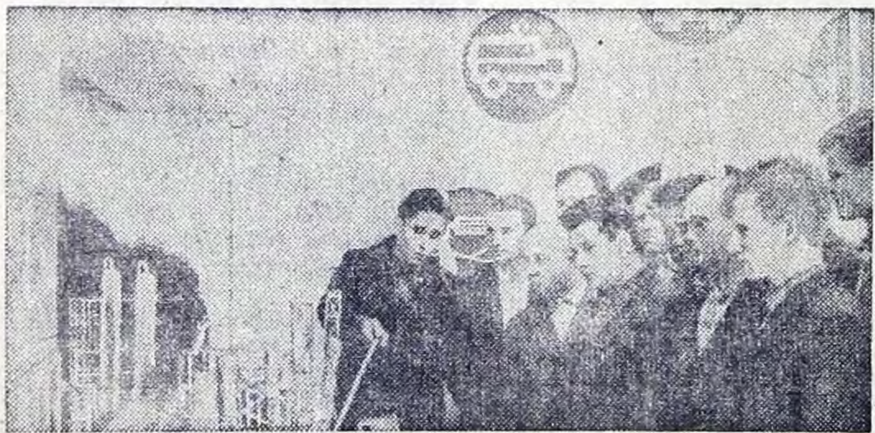
В Перми открылась постоянно действующая пожарно-техническая выставка, где демонстрируются разнообразные технические средства тушения пожаров. На базе выставки организуется изучение руководителями промышленных предприятий, колхозов, совхозов правил пожарно-технической безопасности.

Соревнования на приз «Кожаный мяч» в этом году закончились, а впереди у спортсменов новые тренировки, товарищеские встречи, новые соревнования. Много забот и у их тренера Владимира Зайцева. Впереди напряженный год. С. УСОВА.