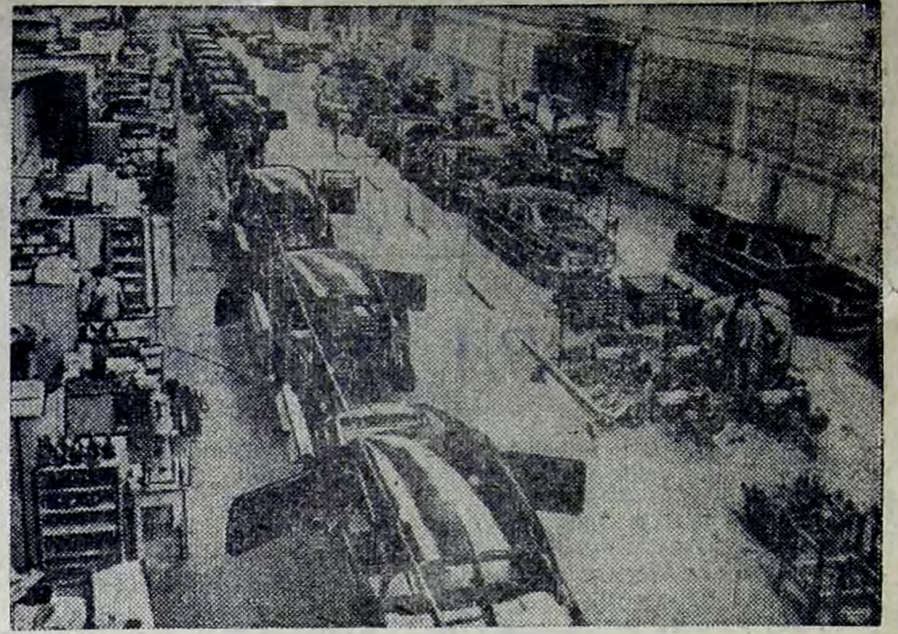
Автомобили — важная статья чехословацкого экспорта. Их покупают 50 стран мира. Перспективный план развития автомобилестроения предусматривает, что к 1980 году половина всех автомашин чехословацкого производства будет экспортироваться.

На снимке: линия сборки известных машин «Татра-63» на автомобильном предприятии «Татра-Копршвице».