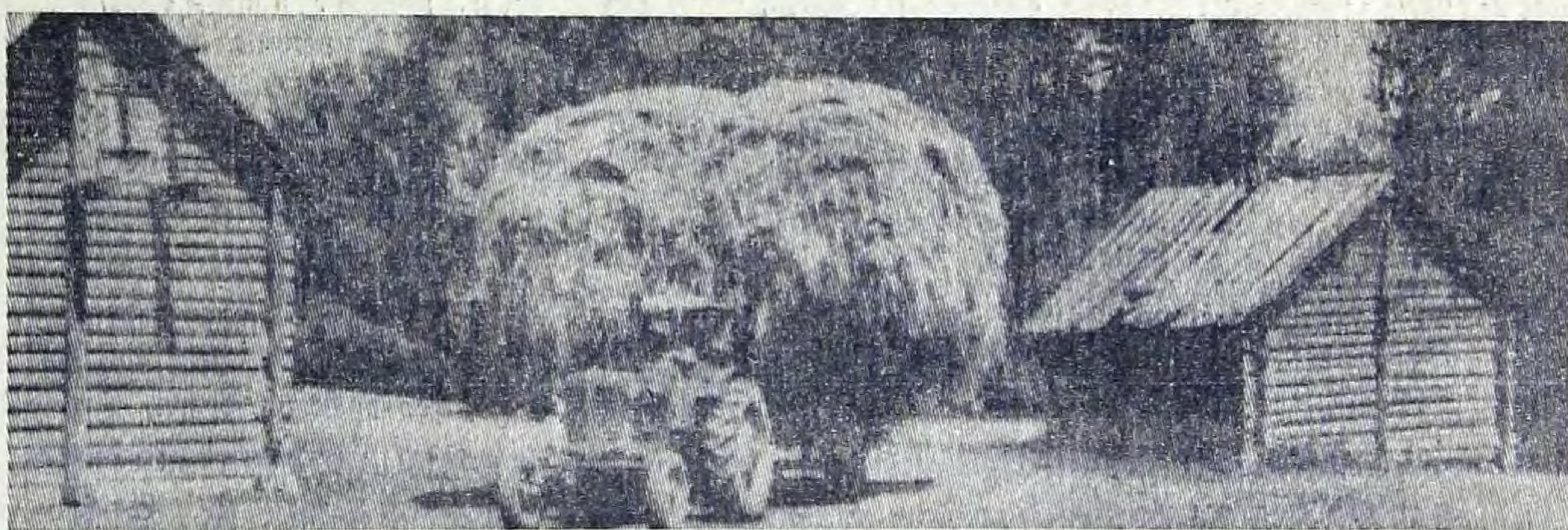
Во второй бригаде колхоза имени XXI съезда КПСС успешно идет перевозка сена на фермы.

МЕХАНИЗАТОРЫ БАЛАКОВСКОГО РАЙОНА! РАВНЯЙТЕСЬ НА ПЕРЕДОВИКОВ СОРЕВНОВАНИЯ. ДОБИВАЙТЕСЬ ВЫСОКОПРОИЗВОДИТЕЛЬНОЙ РАБОТЫ КОМБАЙНОВ И АВТОМОБИЛЬНОГО ТРАНСПОРТА НА УБОРКЕ УРОЖАЯ В ЮБИЛЕЙНОМ ГОДУ.