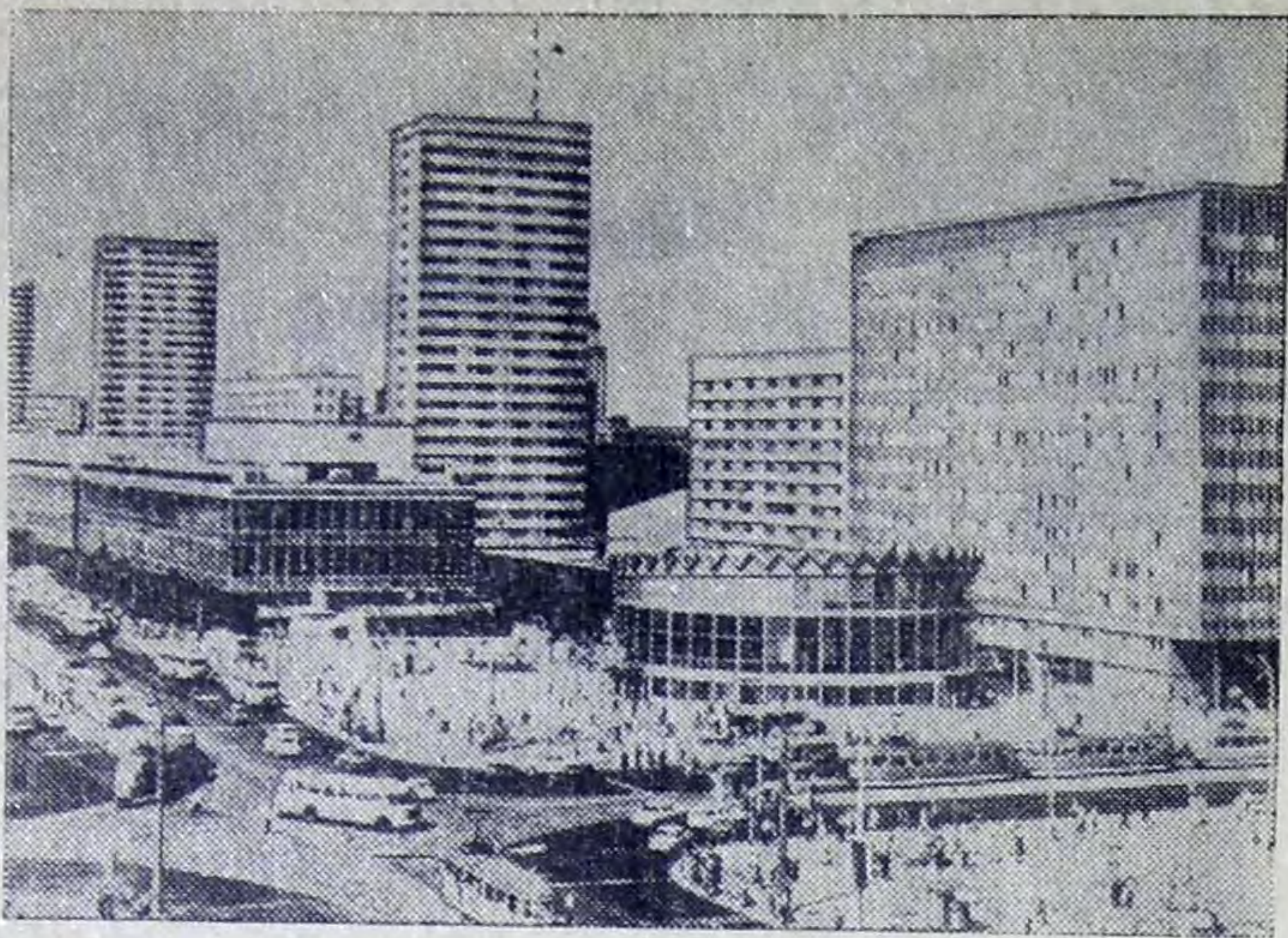
На снимке: Маршалковская улица — центральная магистраль Варшавы. Разрушенная на девяносто процентов в годы войны польская столица полностью залечила раны и стала намного прекраснее. Ее население сейчас составляет 1 миллион двести тысяч человек.