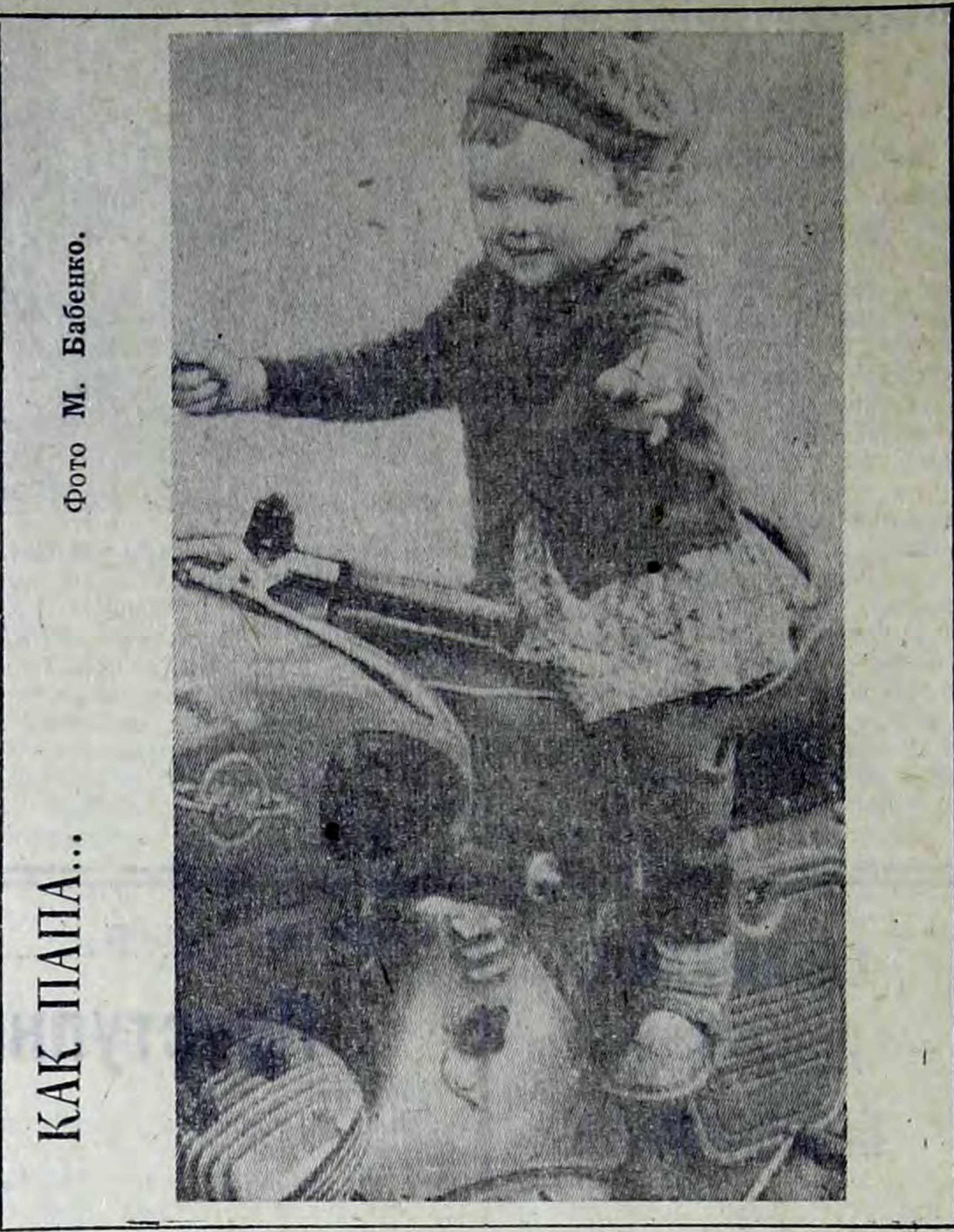
КАК ПАПА...

площадку, но сейчас она полностью разрушена. Мы боремся за уменьшение шума на улицах города, за то, чтобы Балаково был нарядней и краше. А здесь, под окнами жилого дома устраивают стоянку автомашин, безнаказанно разрушают детскую площадку и работники домоуправления смотрят на это «сквозь пальцы». А вот еще пример безответственности, плохой заботы о людях. Давно уже заселено семейное общежитие в первом микрорайоне. Но здесь нет не только асфальтовых дорожек, цветов и зелени, но до сих пор не побелен фасад дома. И стоит на берегу канала многоэтажное строение мрачного вида и пассажиры проходящих пароходов ни за что не догадываются, что в этом доме живут семьи химиков с детьми, что в нем расположен детский клуб «Романтика» и домоуправление № 5 комбината химического волокна. Конечно, многое в благоустройстве Балакова зависит от самих горожан. Не трудно дружно выйти на воскресник, убрать территорию, вскопать землю, посадить деревья, цветы. Но руководить этим обязаны работники жилищно-коммунального управления. Строители же, уходя из дома, не должны оставлять после себя «память» в виде обломков арматуры, куч бетона, рытвин и кочек. А. КУЗИНА.