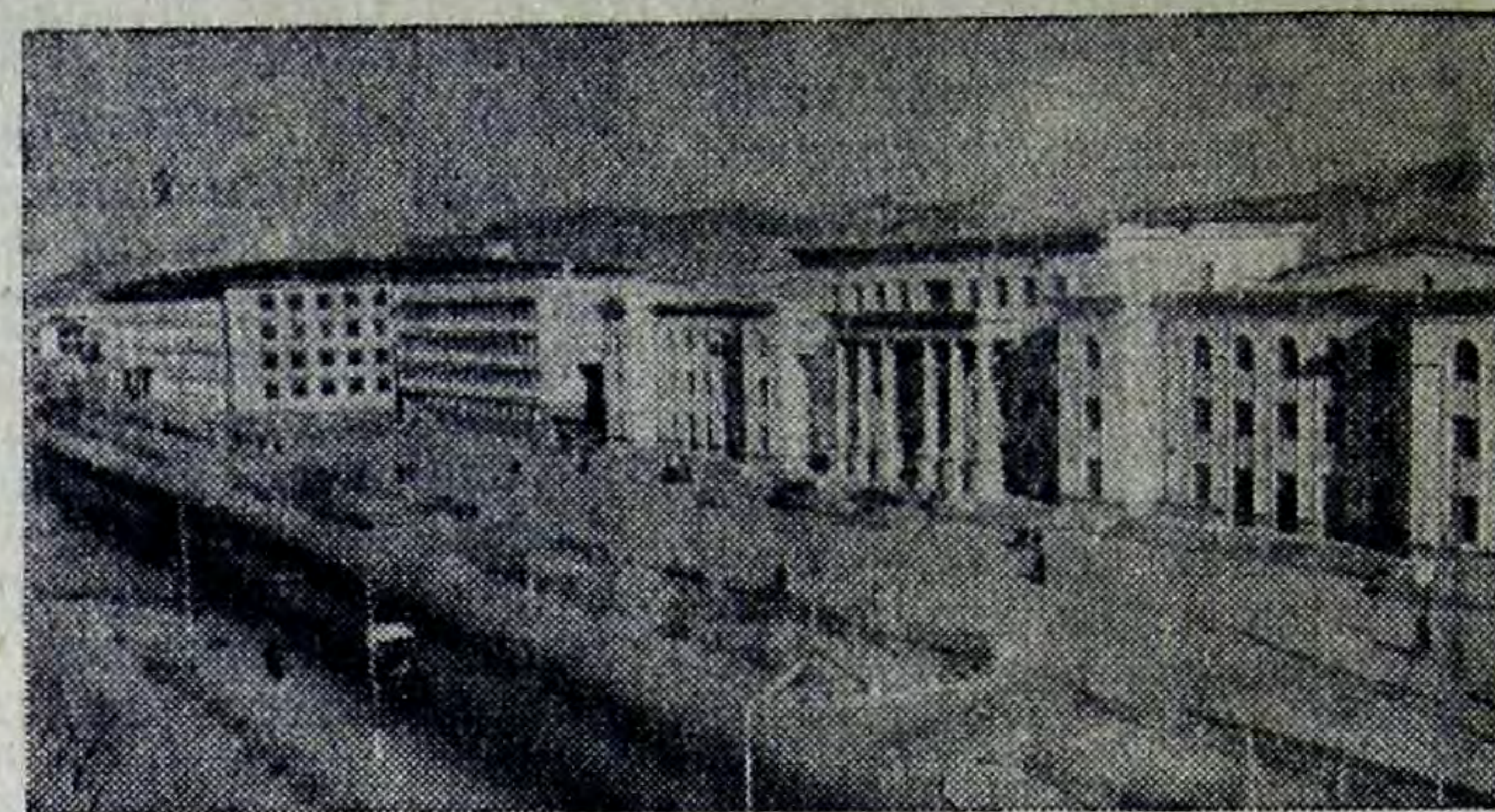
Улан-Батор. Вид на Спортивную улицу.