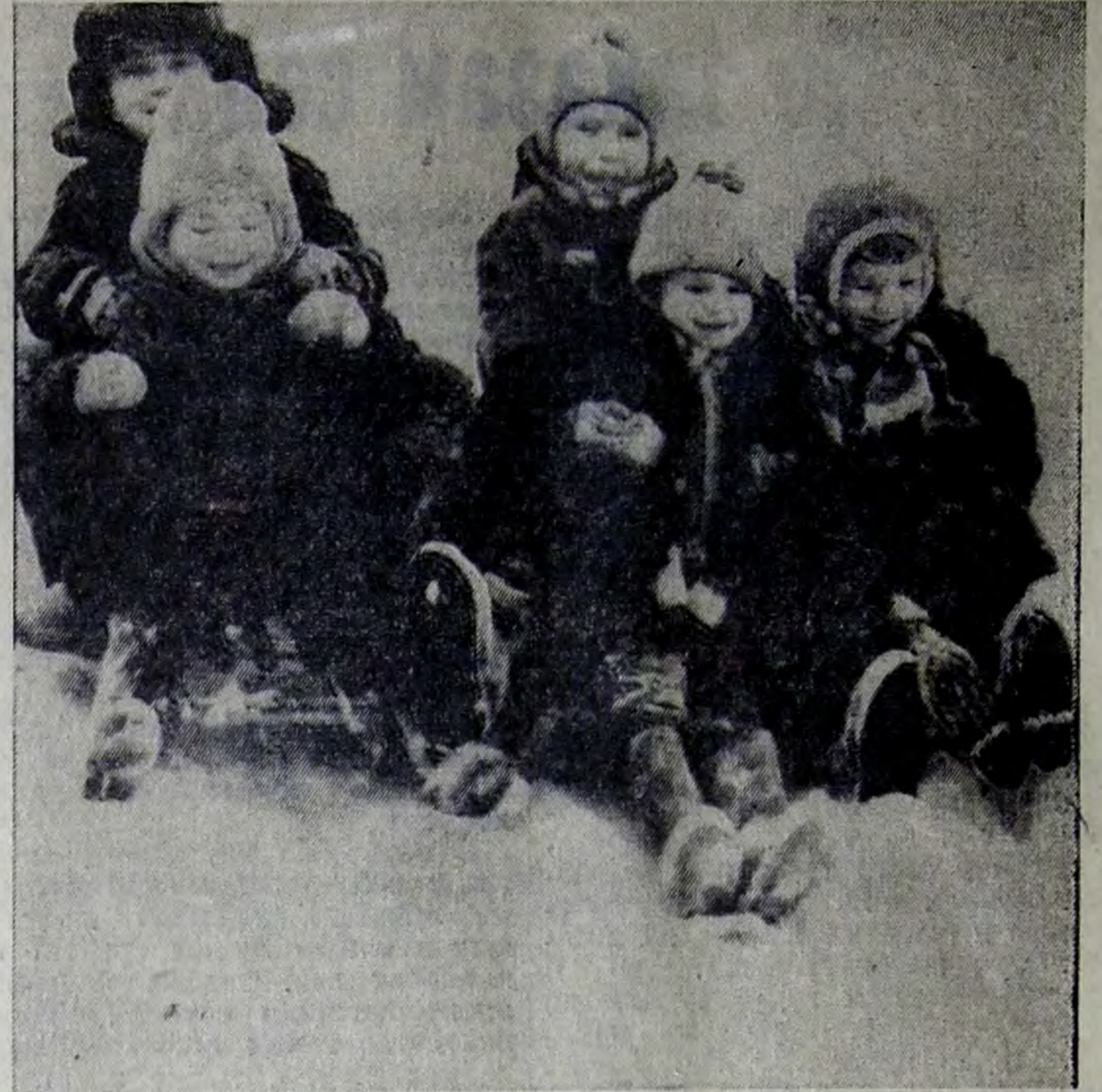
Еще секунда и...