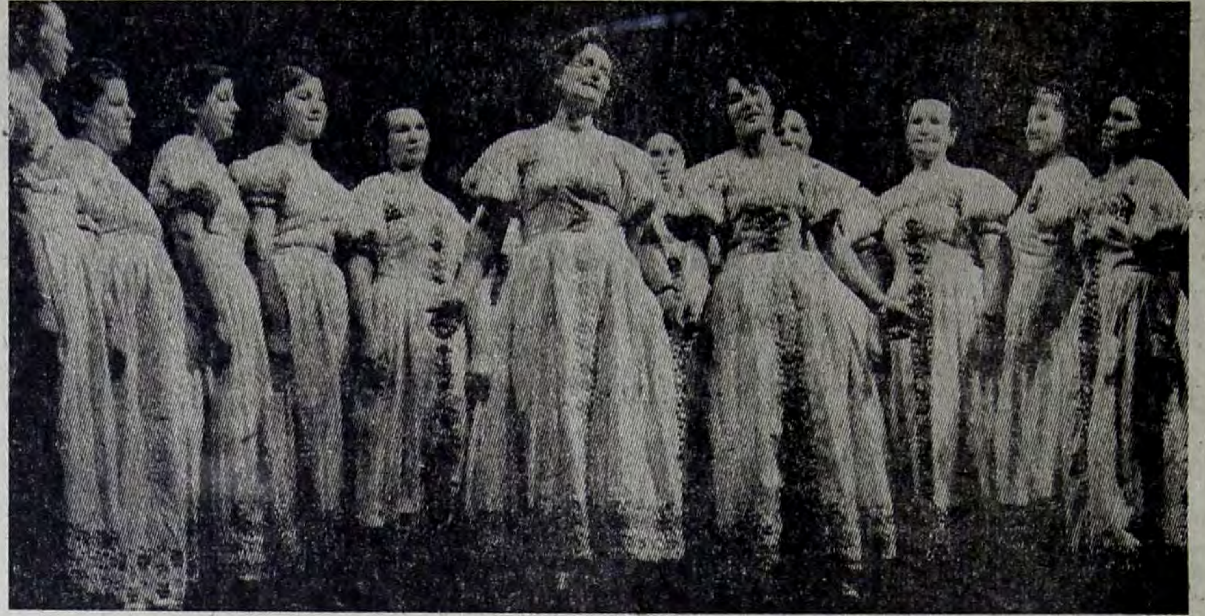
На проходящем смотре сельской художественной самодеятельности хорошей оценки заслужил хор Красноярского Дома культуры. Участники хора — рядовые колхозники, доярки, свиноводы и интеллигенция колхоза имени Свердлова.