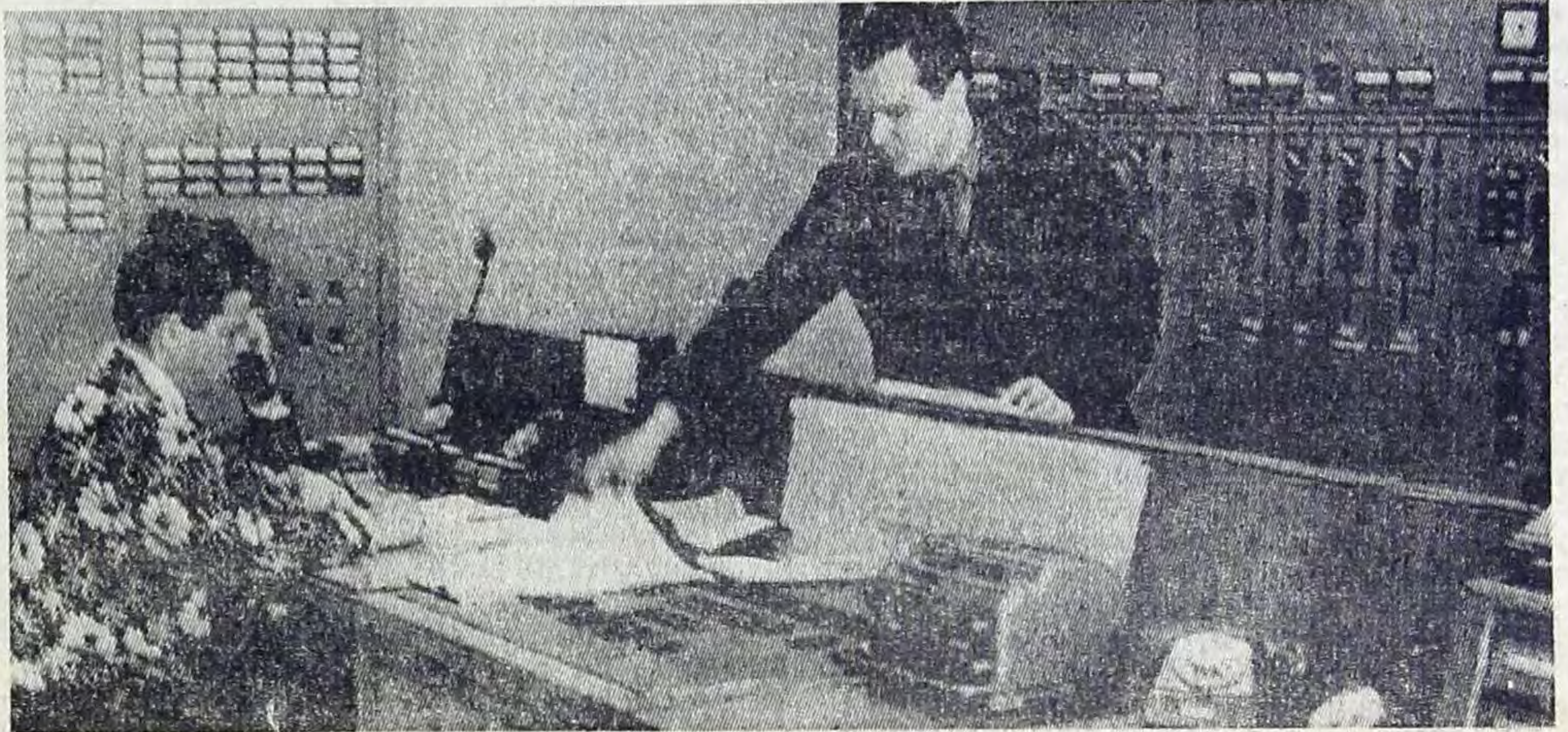
Неустанно несут трудовую вахту энергетики.