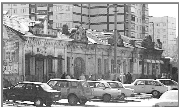
Дом Видункина, пивная и бакалейная лавка «Жигули» со стороны Марининской.