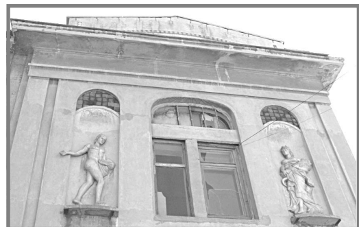
Теллус и Церера на доме Шмидта.