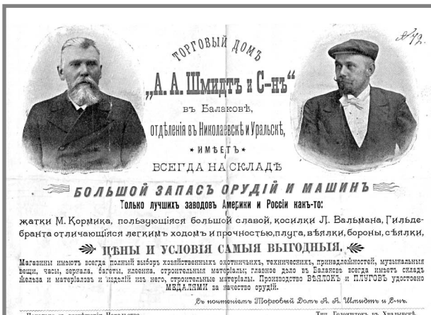
Лицевая сторона квитанции Торгового дома.