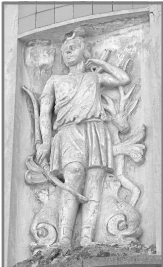
Диана на доме Шмидта.