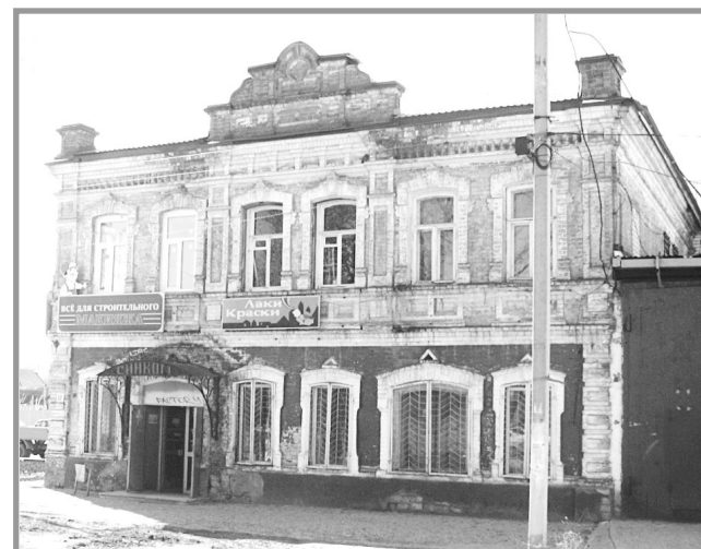
Дом Басислова, мучная лавка Меркурьева.