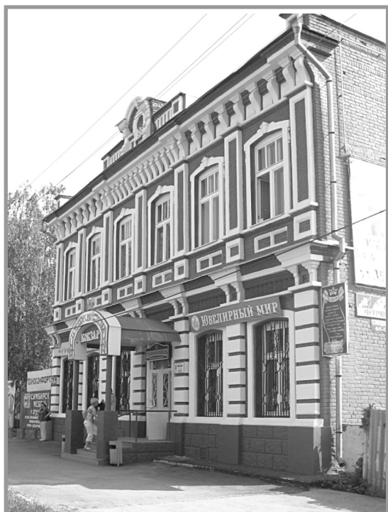
Дом Кобзаря, совр. вид.

лаково за их посещение нас в лазарете и за их подарки.