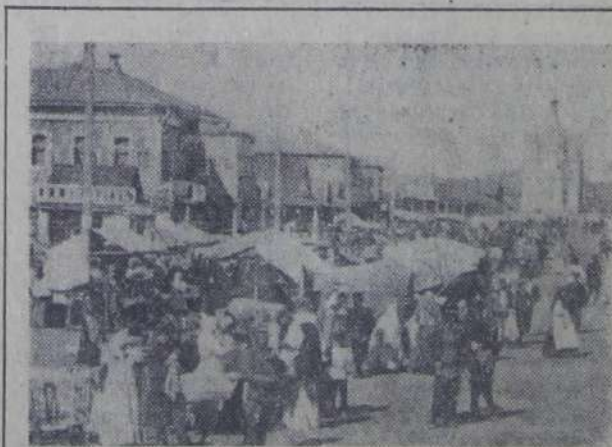
Таким был купеческий Балаково накануне революционных событий.