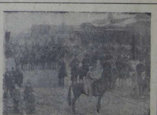
Вихрем ворвалась революция на улицы и площади. Конармейцы на параде, посвященном второй годовщине Октября.