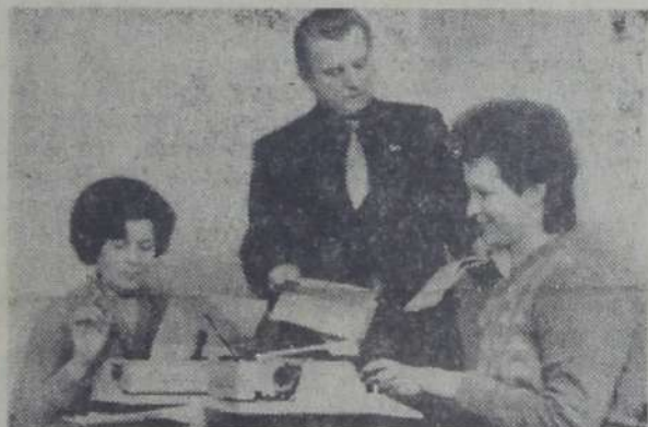
Буртовая, ознакомив с корреспонденцией редактора, принимает необходимые меры.

Каждое письмо требует особого внимания. Поэтому в работе отдела писем никогда не спадает напряжение. Заведующая отделом Г.