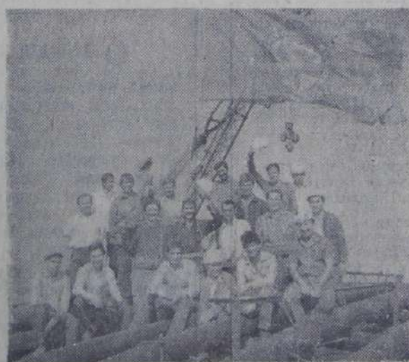
Вот она, долгожданная победа создателей второго энергоблока АЭС! Высоко реет флаг в честь трудовой победы строителей.